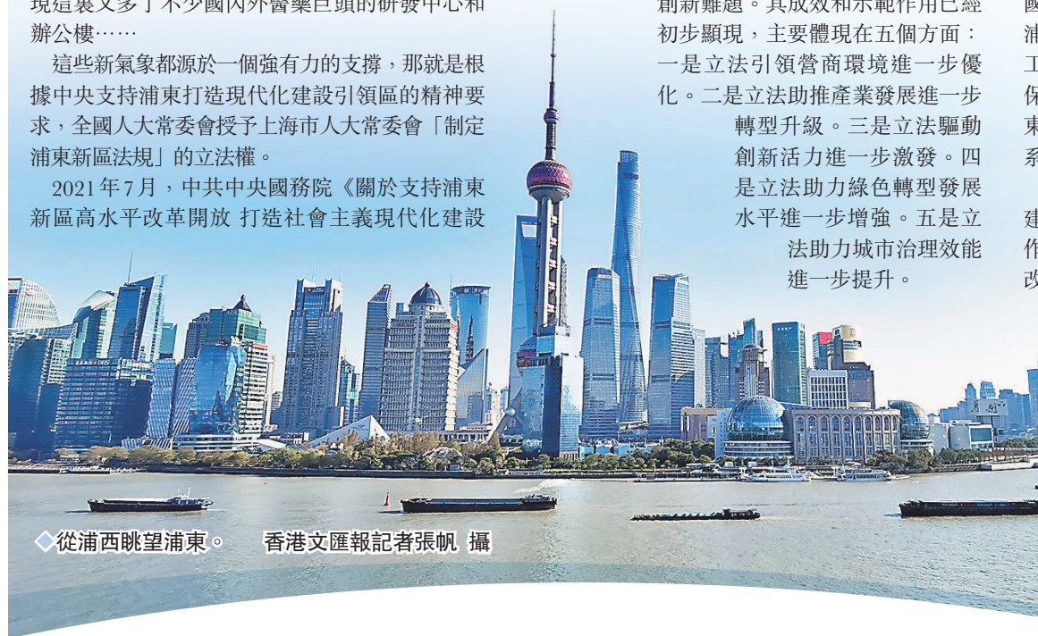
◆從浦西眺望浦東。 香港文匯報記者張帆 攝

◆商戶的牆上再也找不到密密麻麻的證照，取而代之的是一張《行業綜合許可證》。 整理：香港文匯報記者 張帆 受訪者供圖