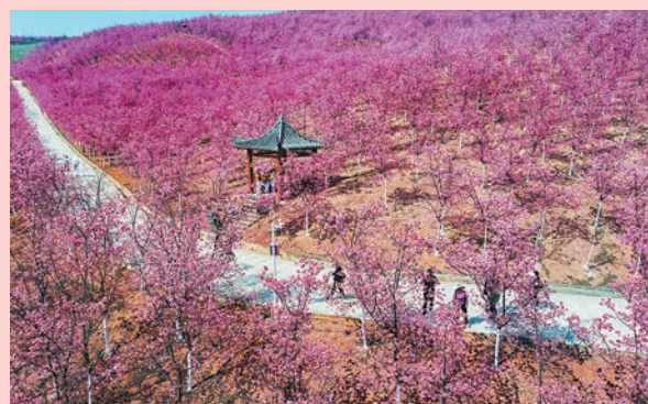
◆遊客在宜良縣山後櫻花谷觀光遊覽。

里，園區佔地3800畝。這兒是雲南程春種植有限公司歷經近14年的努力，使荒山變密林，在山後社區投資建設了宜良縣櫻花谷景區，種有雲南櫻花、山櫻花、冬櫻花、垂枝櫻花、紅葉櫻花、台灣鐘櫻花、韓國變色龍等61個品種，分為早櫻花、中櫻花、晚櫻花。 花期：從每年12月底延續至次年4月中旬，前後長達4個月。