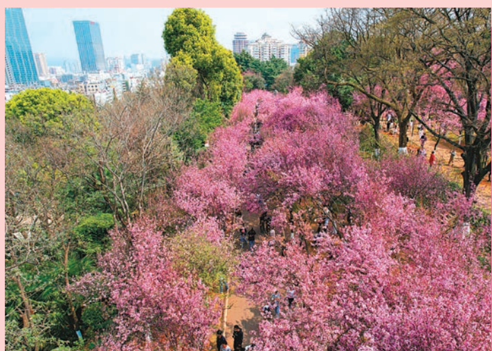
◆圓通山的昆明動物園

這兒的櫻花區是動物園植物景觀的重點，為此每年進行更新、補種、擴大，1991年為迎接第三屆中國藝術節，新種櫻花250株，延長櫻花道100米；新種垂絲海棠200株，延長垂絲海棠道