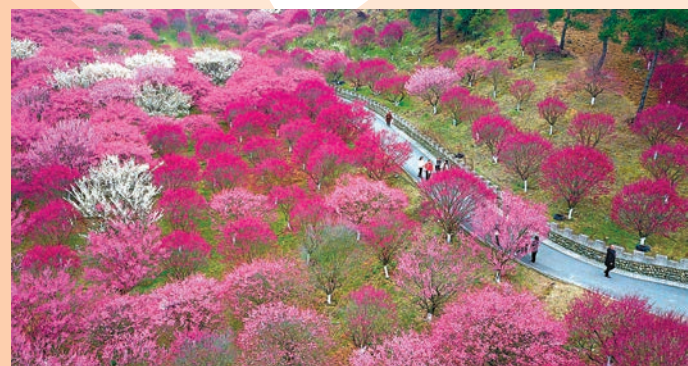
◆遊客在秦巴生態植物園賞花遊玩。

眼下，在位於湖北省十堰市茅箭區馬家河村的秦巴生態植物園中，300多畝梅花如畫般盛開。朵朵梅花吐蕊展瓣，微風拂過，綴滿枝頭的梅花搖曳生姿，暗香浮動。秦巴生態植物園中梅花主要品種有骨裏紅、白梅、綠鄂梅等，人們穿梭在梅林間踏春賞花，或觀賞，或拍照，或休憩，盡情享受大自然的美好饋贈。