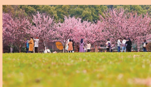
◆武漢大學珞珈廣場附近早櫻競相綻放。