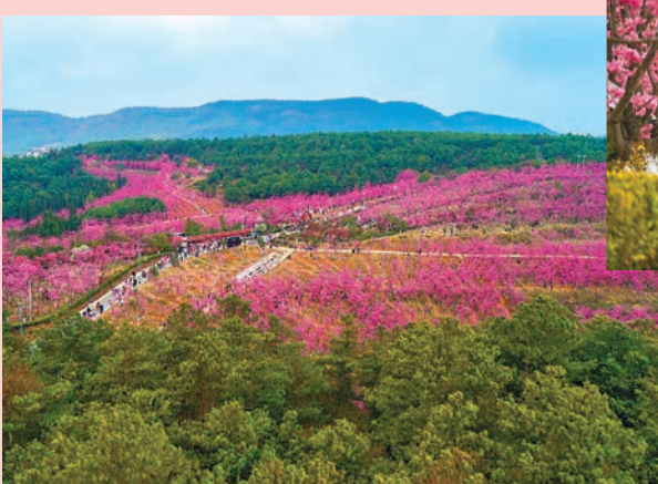
◆馬龍區沈家山櫻花谷

3月，雲南曲靖馬龍櫻花節，沈家山櫻花谷櫻花次第開放，滿山櫻花飄舞，櫻花谷深處漢服秀、旗袍秀、唐裝秀、網紅打卡點、花仙子評選活動、遊園活動、萌寵樂園……一定會牽動你的心。當中，在曲靖市馬龍區沈家山櫻花谷的400餘畝櫻花陸續綻放，吸引遊客前來觀光遊覽。