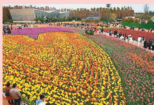
◆遊客在鬱金香花海中遊覽。