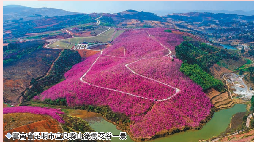
◆雲南省昆明市宜良縣山後櫻花谷一景