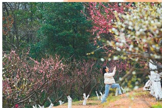
◆湖南省植物園早櫻、梅花盛開，吸引遊人前來打卡。

近日，湖南省植物園早櫻、梅花盛開，園區分為櫻花園、木蘭園、陸生植物珍稀植物園、杜鵑園、竹園、茶花園、桂花園、彩葉植物園等10個植物專類園，園區內有銀杉、珙桐等國家一級保護植物和黃腹角雉一級保護動物，吸引遊人前來「打卡」拍照。