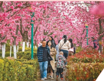
◆遊客在馬龍區沈家山櫻花谷觀光遊覽。