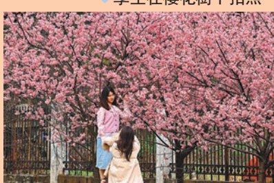
◆學生在櫻花樹下拍照。

在湖北武漢，盛開的櫻花引人觀賞。當中，武漢大學珞珈廣場附近的早櫻更競相綻放，吸引不少賞花人前來拍照打卡。 花期：3月中旬至4月初是最佳觀賞期。