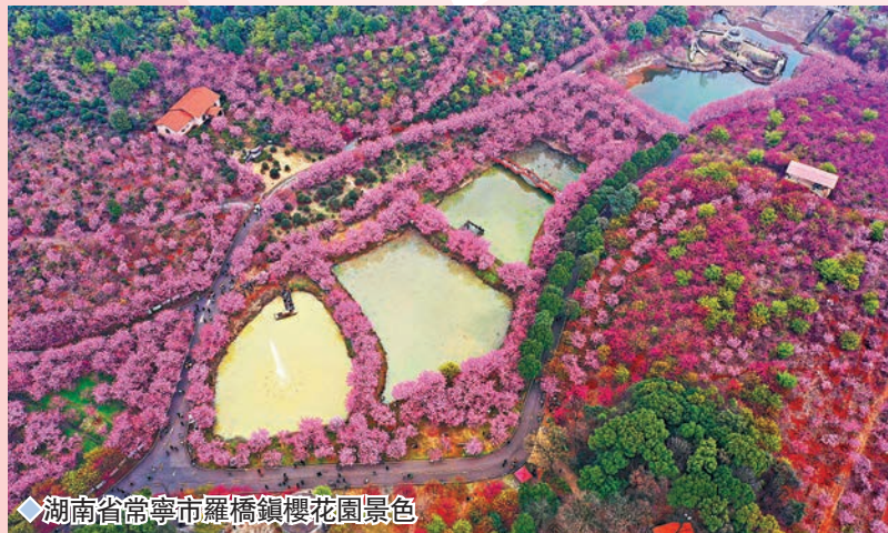
◆湖南省常寧市羅橋鎮櫻花園景色