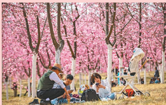
◆遊客在宜良縣山後櫻花谷櫻花樹下休憩。