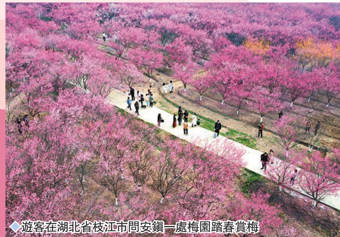
◆遊客在湖北省枝江市問安鎮一處梅園踏春賞梅