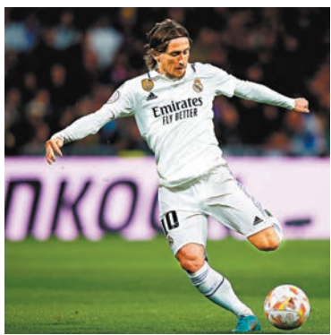
◆皇馬中場核心莫迪歷頗受監刑滿復出。資料圖片

歐聯再次衛冠失敗的法甲班霸巴黎聖日耳門（PSG），在尼馬缺陣下美斯和麥比剛戰啞火後，法甲是役作客面對第15位的比斯特，更加是入球心切（Now639台周日4：00a.m.直播）。在意甲積分榜一騎絕塵的拿波里，主場又會否與同樣擅於進攻的阿特蘭大，上演一場入球好戲（Now638台周日1：00a.m.直播）？