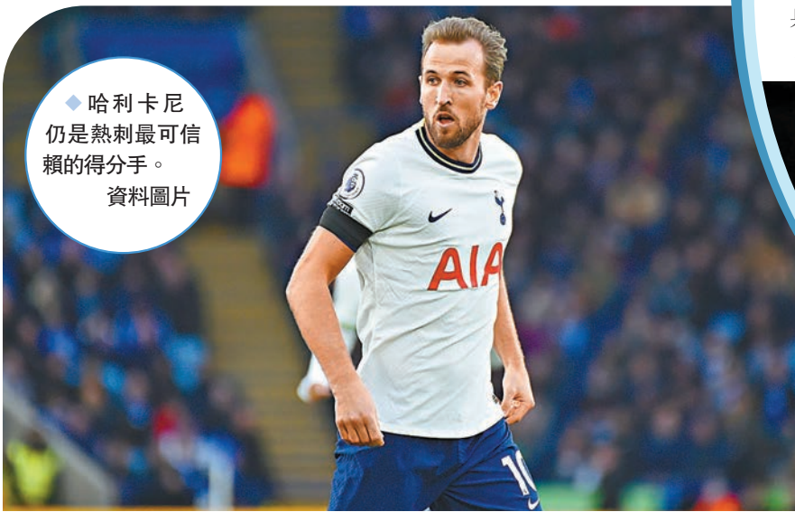
◆哈利卡尼仍是熱刺最可信賴的得分手。資料圖片