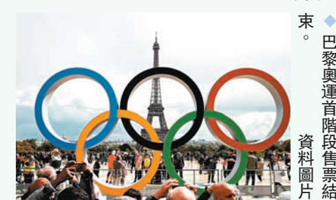
◆巴黎奧運首階段售票業績。資料圖片

巴黎奧運會第一階段門票銷售於近日結束，組委會當地時間9日公布了第一階段門票銷售的具體情況，共有來自158個國家和地區的觀眾參與購買，其中有三分之二的用戶來自法國本土，合計有325萬張門票售出，而相較於以往的奧運門票銷售，此次購票人群中女性觀眾的比例有所增加，達到了45%。第一階段門票銷售包含了除衝浪以外的所有競賽項目，攀岩與自由式小輪車的門票在放票當天就全部售罄。劍擊、柔道、霹靂舞以及場地單車等項目也頗為熱門，放出的門票在幾天之內就全部售罄。巴黎奧運會共計將出售1,000萬張比賽門票，其中有80%將直接面向普通公眾，第二階段門票銷售將於3月15日啟動。