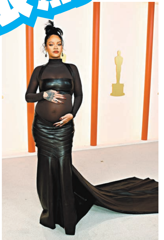
◆ Rihanna 大秀個性魅力，盡顯時尚辣媽風範。