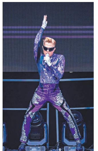
◆ 城城閃紫豹紋舞衣型格十足，盡現舞台王者風範。