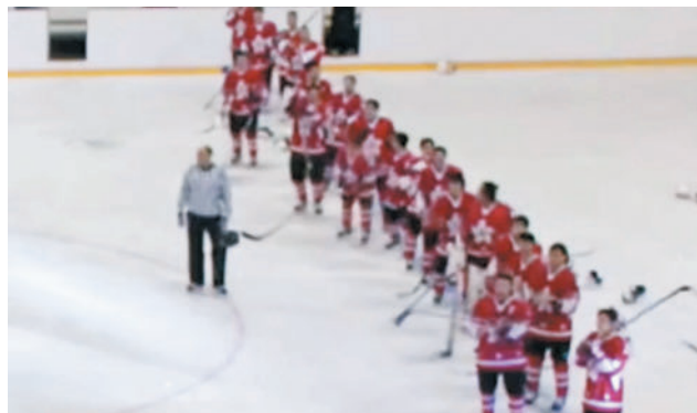
香港冰球代表隊早前於波斯尼亞勝出時播錯國歌。