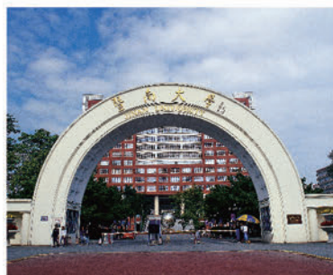
基金將透過大灣區內地大學參觀計劃，帶領香港的高中生前往灣區內地城市的熱門大學參觀交流。