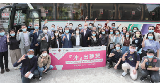
大灣區青年基金的「策願計劃」所資助的「沖出夢想」—太平洋咖啡X港專@大灣區創業培訓計劃。參加者早前前往深圳實習。

內地與香港已全面恢復正常跨境往來，香港青年正好藉着這時機前往灣區內地城市，探索發展機遇。大灣區共同家園青年公益基金(下稱「大灣區青年基金」)公布，將於本年內投放超過港幣1,200萬元，透過多元化交流項目，支持香港青年到大灣區各個城市了解最新發展，預計受惠人數超過10,000人。基金支持的重點項目包括「粵歷交流計劃」、「灣行者」交流計劃、「實幫你」實習及就業計劃、「升學易」計劃、「策願計劃」、「創明天獎學金」大灣區體驗之旅、「灣區啟航—金融才俊計劃2023」、YO PLACE會員「灣區周圍WALK」、香港高中學生大灣區內地大學參觀計劃、團體合作交流及實習資助計劃等，支持他們在升學、就業及創業上於灣區尋找機遇，在更廣闊的舞台上一展抱負。