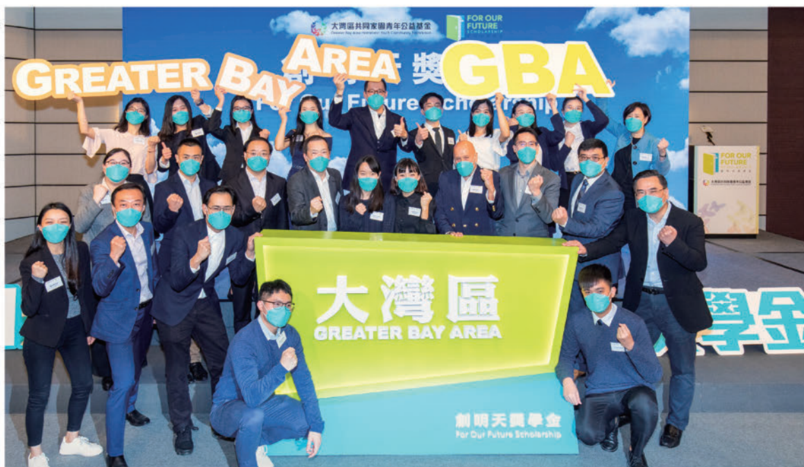
大灣區青年基金將為「創明天獎學金」得主舉辦大灣區內地城市深度交流及體驗之旅。