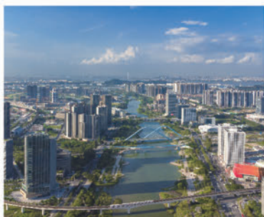
基金推出「2023粵歷交流計劃」鼓勵香港青年認識大灣區城市最新發展，圖為南沙。

內地與香港已全面恢復正常跨境往來，香港青年正好藉着這時機前往灣區內地城市，探索發展機遇。大灣區共同家園青年公益基金(下稱「大灣區青年基金」)公布，將於本年內投放超過港幣1,200萬元，透過多元化交流項目，支持香港青年到大灣區各個城市了解最新發展，預計受惠人數超過10,000人。基金支持的重點項目包括「粵歷交流計劃」、「灣行者」交流計劃、「實幫你」實習及就業計劃、「升學易」計劃、「策願計劃」、「創明天獎學金」大灣區體驗之旅、「灣區啟航—金融才俊計劃2023」、YO PLACE會員「灣區周圍WALK」、香港高中學生大灣區內地大學參觀計劃、團體合作交流及實習資助計劃等，支持他們在升學、就業及創業上於灣區尋找機遇，在更廣闊的舞台上一展抱負。