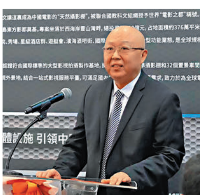
青島市文化和旅遊局副局長辛龍