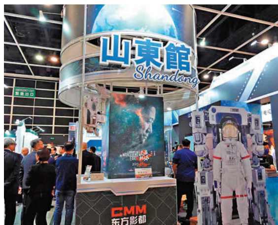
「山東館」整體設計融匯太空科技元素。