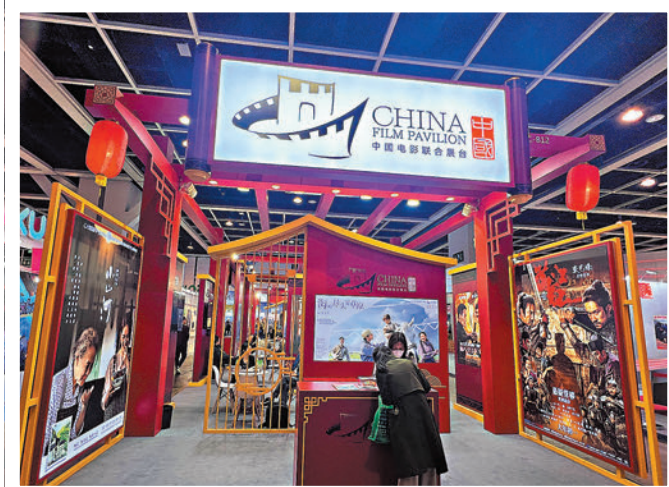
博納影業的展區位於中國電影聯合展台。

即使從市場到製片的變化風雲萬千,他的朝氣和對市場的信心始終沒有被磨滅。「當年《長津湖》創下票房第一的時候,《戰狼》劇組發來慰問信鼓勵我們,我們希望之後還有更多的電影超越《長津湖》,希望業界同仁齊心協力創造一個又一個的輝煌,中國電影就是要靠不斷超越和自我完善,才能實現最終的追求和理想。」最後,他以八字寄語中國電影產業——乘風破浪,未來可期。