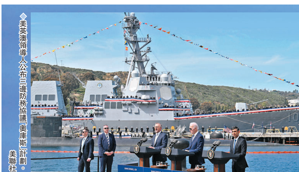
◆美英澳領袖公布三邊防務協議與奧庫斯計劃。