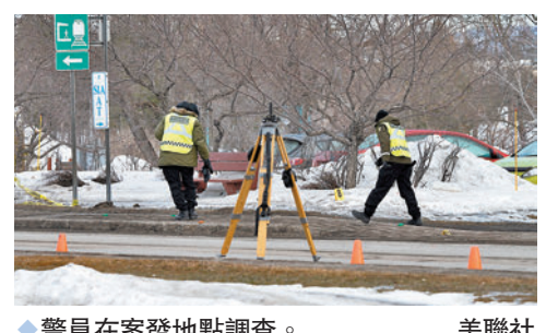
◆警員在案發地點調查。