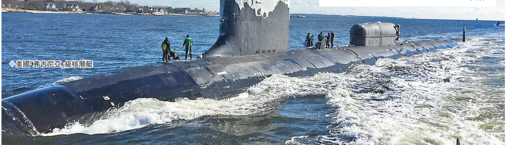
◆美國「弗吉尼亞」級核潛艇

◆技術轉讓 核潛艇技術是美國嚴格保密的軍事技術之一，涉及美國《國際武器貿易條例》下的技術轉讓要求，還被歸類於「不可向國外透露」的技術保密級別，以及禁止與非美國國民共享。即使美方宣稱有辦法與澳洲分享核潛艇推進技術，在後續的超音速武器研發等領域，3國能否合作仍然存疑。