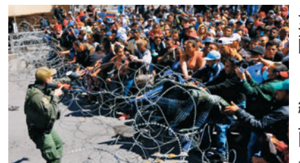
◆數百人硬闖美墨交界邊關。網上圖片