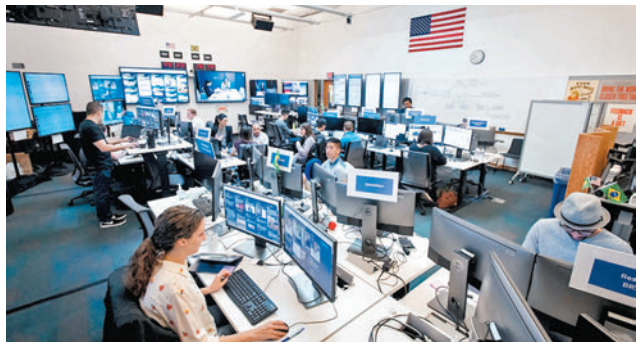
◆Meta去年11月已宣布裁員1.1萬人，佔公司人手13%。