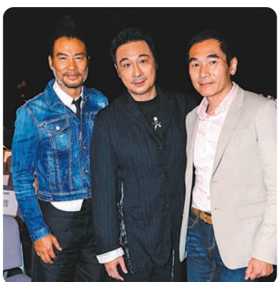
◆左起：任達華、吳鎮宇與方中信合拍電影《內幕》。

撈，唔怕有幾高，Go Go Go！」他又打趣指因看到身後為他拉威力的龍虎獅舞都是相熟的人，沒有人傾側，好靠得住。三人都已為人父，講到仔女更是雞啄唔斷，鎮宇透露兒子吳費曼雖然15歲，但有182cm高及90kg體重，並爆兒子喜歡食和坐，不愛做運動，雖然希望兒子多做運動，但他笑道：「我唔敢話佢，驚佢報復。」任達華建議鎮宇可訓練兒子當摔角手；但說到任達華的女兒盡得父母優良遺傳，會否加入娛樂圈，任達華要太極說：「今日冇私人內幕！」