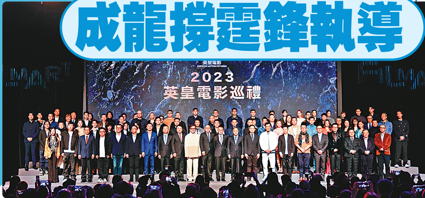
◆《2023 英皇電影巡禮》昨日舉行，全港影視娛樂公司老闆和高層及多位巨星齊集。