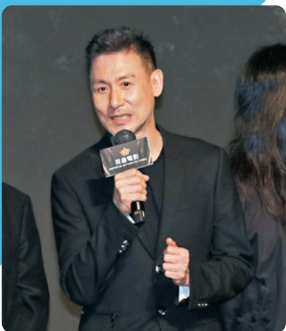
◆提到宣傳片中有連場動作戲，學友幽默回應。