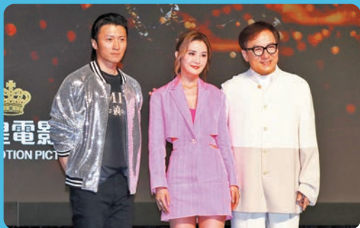
◆成龍(右)、謝霆鋒(左)和蔡卓妍將再合作拍《新警察故事2》。