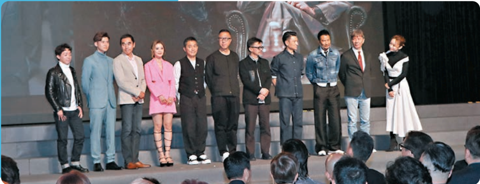
◆即將上映的電影《金手指》劇組上台。

巡禮上播放了《金手指》、《爆裂點》、《內幕》、《海關戰線》4部今年上映的電影宣傳片及公布來年的大製作，包括《新警察故事2》、《無限任務》和延續已故導演陳木勝精神的《怒火蔓延》等，當中霆鋒演出4部電影，並且首次當導演及動作指導；偉仔和華仔亦相隔20年再度在電影同框。楊受成博士更於片尾表示英皇一直初心不變，為電影藝術喝彩！