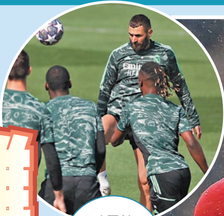
◆法國射手賓施馬(右上)隨皇馬操練中。

拿比基達因傷缺陣下，只有法賓奴及佐敦軒達臣可堪大用，巴積域及哈維艾利諾無論在經驗及個人能力上均難以完全發揮高位迫搶的精髓，中場問題導致利物浦對比賽的掌控力大幅下降，是球隊今季表現時好時壞的主因之一。 皇馬縱下滑主場仍可靠 可以預期利物浦今仗為收復失地，甫開賽便會不惜體力的迫搶和搶攻，不過經驗豐富而且擁有上乘技術的皇馬卻是高位迫