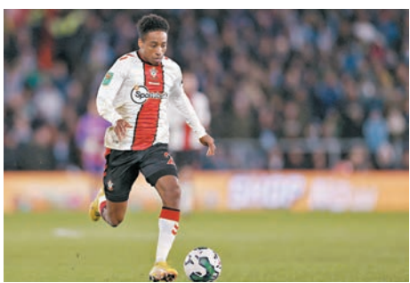
▶修咸頓後衛獲加彼德斯遭到網絡上種族主義的攻擊。