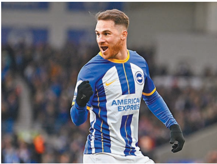
▲阿歷斯麥亞里士打是白禮頓中場的一大驚喜。

◆香港文匯報訊(記者 梁志達) 英超聯賽將在本港時間周四凌晨上演兩場賽事，其中正在衝擊歐洲賽席位的白禮頓，將挾勇態於主場撲擊水晶宮(Now621台周四3:30a.m.直播)；水深火熱的修咸頓則希望趁近來反彈的士氣，在自己地頭擊退賓福特搶得3分(Now622台周四3:30a.m.直播)。 白禮頓上仗作客列斯聯被逼和2:2，近5輪聯賽有1勝2和1負，在積分榜第7位落後多賽1輪排第5的紐卡索5分，距離並不算遠，依然有望爭取來屆歐洲賽資格。阿根廷上位中場新星阿歷斯麥亞里士打，剛戰助白禮頓先拔頭籌，移前踢進攻中場連續兩場有進賬；而為他送出助攻的三笥薫，和蘇利馬治及前鋒伊雲費格遜這個攻擊組合，以及對上5個主場4勝的主場戰意，都是「海鷗兵團」的爭勝本錢。面對連續10場英超不勝、近4戰作客3敗的水晶宮，預計白禮頓贏波機會還是較高。