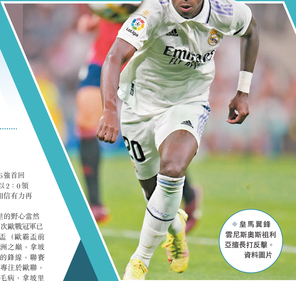
◆皇馬翼鋒雲尼奧斯祖利亞擅長打反擊。資料圖片