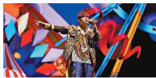
◆聽歌也可以學好普通話。圖為周杰倫演唱會。

比如針對平舌音的「三山四水、四和十」，舌尖中音的「麵舖和棉窗簾」等。雖然繞口令對於普通話基礎要求較高，但卻可以使學生頭腦反