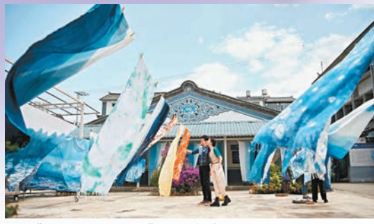
◆《去有風的地方》以6個語種上線YouTube平台，受到海外年輕觀眾追捧。資料圖片

展示去年3月上線的全球影視版權交易雲平台C-DramaRights，雲平台的定位為數字化B2B影視版權交易平台，集版權保護、確權、分發和交易於一體，成為全球買家及時了解並一站式購買華語優質內容的窗口和平台。目前，雲平台已上線9,000多小時的優質內容，全球用戶已超過4,000家。