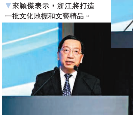
▲來穎傑表示，浙江將打造一批文化地標和文藝精品。