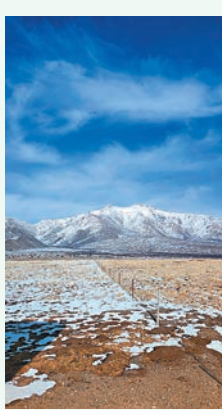
◆崑崙山的盛景深深震撼作者的心靈。

柱」，被藏族群眾稱為「鎮神山柱」。 我在內地跨過山川湖海，也闖過人山人海，多年尋根之路上一直期待到崑崙山感受體驗。終於，機緣到了，我可以親自一睹「崑崙之丘——神秘的年欽夏格日山」，當我站在海拔3,800米崑崙山神祠，面向着4,385米的年欽夏格日山時，它深深震撼着我的心靈，這種感覺和能量場，一生必定最少來一次感悟，看照片是完全沒有可比性的。它獨特的山型地貌和有關西王母的美妙傳說，籠罩着一層傳奇色彩，是研究崑崙文化與發祥變遷的神秘之地，也是探險旅遊的好去處。回到西寧市裏晚飯，喝了不少青稞酒，醉躺在酒店床上，如夢似幻地聽見娘娘的聲音：「京灣子！娘娘應許借汝素色雲旗，另安排玄女助汝一臂之力，汝需多積功累德，潛心修行……」「子得令，謝娘娘！」 第四天，從夢中醒來神清氣爽，青稞酒果然是好酒，高原糧食的酒不宿醉。我邊琢磨着夢境，邊參觀城北區裏正計劃改為文創園的四個舊廠房，再到有2,000年歷史的中國第二大懸空寺——土樓觀參觀，觀裏丹霞山崖上「九窟十八洞」裏殘存兩晉至宋元明時期壁畫，人文藝術價值極高。另外到大學城附近的黃河產業園，了解大學生創新創業及青海的藜麥、黑枸杞和紅鹽。在參觀「中國藏醫藥文化博物館」時，最讓我驚嘆的是館裏展出的80