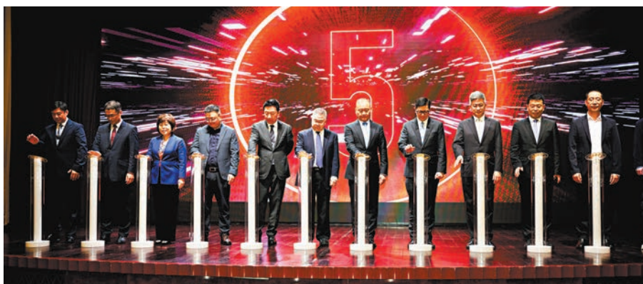
◆紫荊文化集團「大灣區原創紀錄片發展計劃」5項目涵蓋8大類。