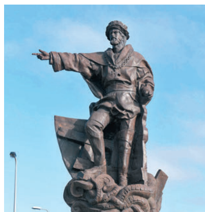
◆ 麥哲倫是大航海時代中其中一位冒險家。圖為麥哲倫塑像。

資者，而葡萄牙王子航海家亨利就是這一個人。在亨利王子的資助下，一支又一支的葡萄牙船隊向南駛去，探索神秘的非洲大陸，並開始連場軍事行動。 數十年間，葡萄牙人把勢力範圍逐步推進，在西非海岸建立貿易站後，又派出迪亞士於1488年通過好望角，然後是達伽馬在1498年抵達印度，再來是「海上雄獅」亞爾布開克攻下果阿與馬六甲。1521年，葡萄牙艦隊到達中國，與明朝水師在香港的屯門爆發海戰，被明軍擊退。後來雙方恢復正常邦交，並於1557年建立澳門殖民地。 不過，葡萄牙的黃金年代並沒有持續多久，雖然他們從東方貿易中獲得大量財富，但國力並沒有增強多少。1578年，年僅21歲的葡萄牙國王塞巴斯蒂安親自率領軍隊到摩洛哥作戰，卻在三王戰役中戰死，由於沒有留下繼承人，葡萄牙因此被西班牙國王強行吞併，加上荷蘭等國的冒起，葡萄牙再也無力奪回其壟斷地位，大航海時代亦翻到新的一章。