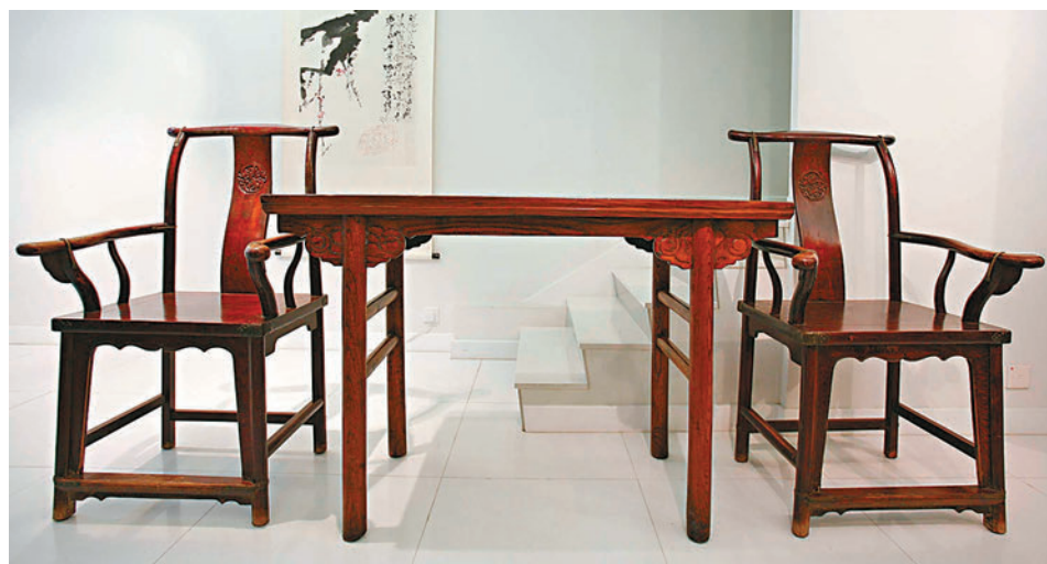
◆ 明清的硬木家具現時價值連城。

木家具的美感。氏著在美國產生了極大的影響，並令部分博物館遵從這種中國家具收藏的範式而建立。艾克甚至認為中國家具在明初達至頂峰，而到17世紀邁向消逝衰落。 值得一提的是，1978年，美國納爾遜美術館(The Nelson-Atkins Museum of Art)的史克門(Laurence Sickman)發表了一篇《The Chinese Classic Furniture》，清楚闡明古典一詞對於描述傳統中國家具是恰當的，因為傳統中國家具的基本結構直接繼承古代，並且具有在任何藝術或文化中古典風格所必備的謹嚴、均衡、清麗、莊重的特徵。 他甚至指出，中國下層社會保留了民間家具的傳統，這一傳統起源於遠遠的古代，並且從木建築法式中學到了結構的簡單和比例的完美；經歷各種時尚和潮流，中國古典家具在幾個世紀始終沒有很大的變化；民間家具中用硬木製作的家具，通常為文人和官僚階層所喜愛。 綜上所述，我們可以得出一個概括的結論，就是早在王老的扛鼎之作面世前300