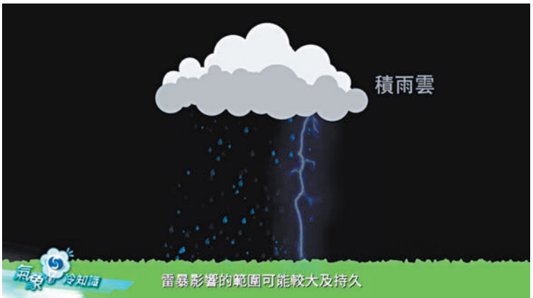
◆ 在活躍的天氣系統，積雨雲可以連綿不絕地產生，雷暴影響的範圍可能較大及持久。影片截圖

那如果出了海才發現有雷暴，又應該怎樣應對才安全呢？安全的原则是當雷暴可能影響身處區域，就要盡快離開水面，尋找附近安全地方上岸暫避，亦要留意小艇或獨木舟可能會被狂風吹翻。還有，即便找到安全地方暫避，也要等雷雨完全過去才離開。