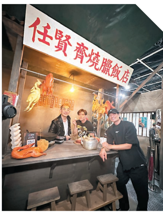
◆任賢齊擔任燒臘店一日店長,招呼伍允龍和黃德斌。