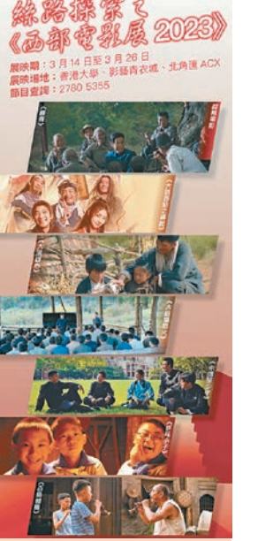
◆《西部電影展2023》正在開展。

展映影片包括《音樂家》、《乒乓小子》、《錢學森》、《永遠是少年》、《大漠雄心》、《百鳥朝鳳》、《大話西遊之緣起》、《解憂理髮店》、《夜宿梨樹灣》等。