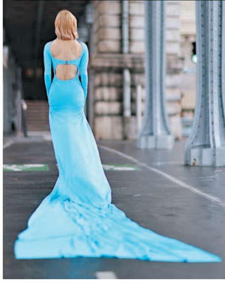
◆Sammi 穿著藍色長裙,背部設計盡顯線條。

香港文匯報訊 鄭秀文(Sammi)2023年第一首派台作品《愛是...2.0》MV遠赴法國取景, Sammi以不同華麗造型穿梭巴黎,其中她在一間超過200年歷史的古老建築物內取景,精緻的天花設計和紅色的布景,濃濃懷舊氣息,她開心得在舞池中不停扭動。