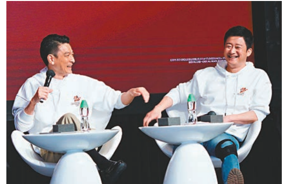
◆劉德華和吳京均是幽默之人,令現場不時傳來陣陣笑聲。