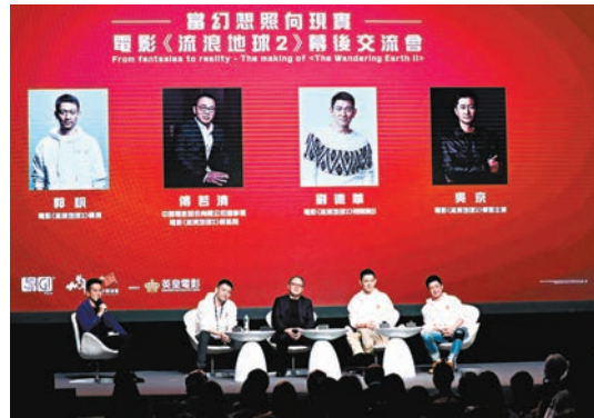
◆電影《流浪地球2》昨日在港舉行幕後交流會。

香港文匯報訊(記者子棠、攝影北山彥)劉德華(華仔)、吳京、總監製傅若清和導演郭帆昨日出席電影《流浪地球2》幕後交流會,獲英皇集團主席楊受成和副主席楊政龍現身支持。交流會圍繞四大主題「夢與幻想」、「從《流浪地球1》到《流浪地球2》」、「奔向未知的想像空間」及「現實的遠大願景」進行探討,並談及對《流浪地球3》的展望,席間華仔更爆料指吳京有意捧他做導演,華仔就想到與吳京合組「京華一夢」開演唱會。