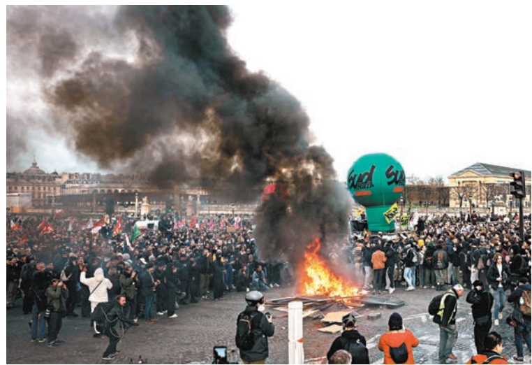
◆示威者在巴黎協和廣場焚燒路障抗議。