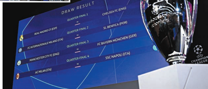
歐聯8強及4強抽籤結果昨晚出爐。