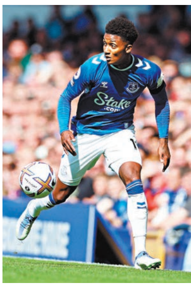
戴治似乎找到了最適合迪馬雷格雷發揮的位置。

默契開始養成,但愛華頓肯定仍會以近期一貫硬碰硬「快上快落」的踢法務求打亂車路士節奏,且看戴治能否再次帶領球隊成功搶得分數。