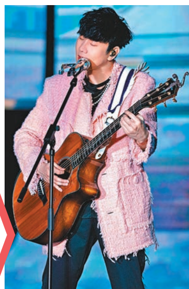
◆林俊傑自彈自唱大晒音樂才華。

林俊傑以《記得》一曲揭開序幕，彈着鋼琴的他緩緩登上舞台，全場即揮動大會派發的紫色應援棒，令現場頓變成紫色燈海。已經 5 年沒有在香港演出的 JJ，多次對觀眾表達思念，又以廣東話表示：「香港嘅朋友好耐冇見！大家好！我係 JJ 林俊傑！」台下觀眾即報以歡呼聲，JJ 見到觀眾如此熱情，直言無法形容自己此刻心情，並表示很歡迎大家到來，他更於台上問道：「有沒有第一次來的朋友？頗多的！挺我一齊長大的鐵粉在哪裏？」看到觀眾歡呼聲不絕，JJ 笑言有很多感觸，所以想將一切放到這次演唱會的音樂中，與大家一同尋找生命中的關鍵詞，繼而唱出《關鍵詞》及《豆漿油條》。