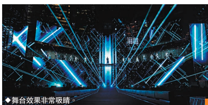
◆舞台效果非常吸睛。