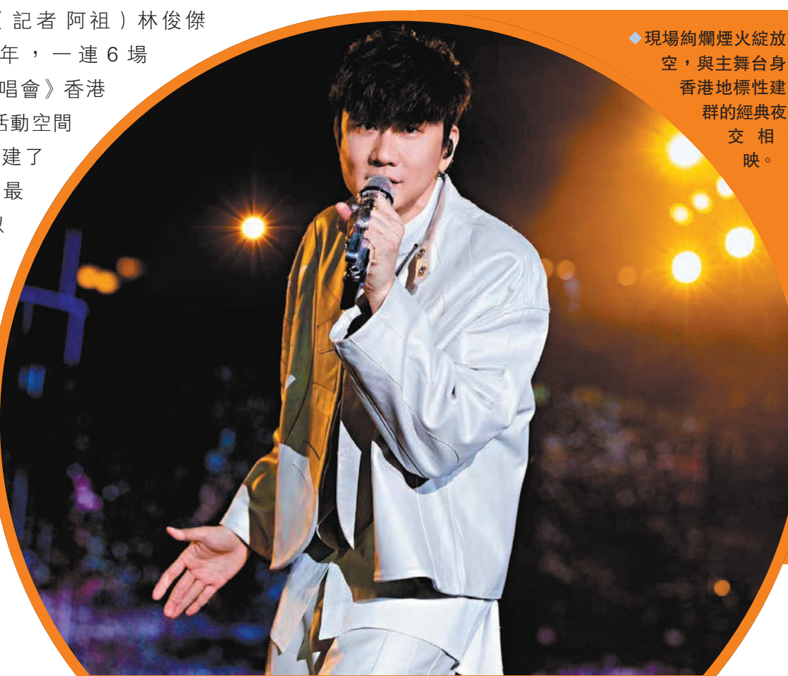
◆現場絢爛煙火綻放夜空，與主舞台身後香港地標性建築群的經典夜景交相輝映。