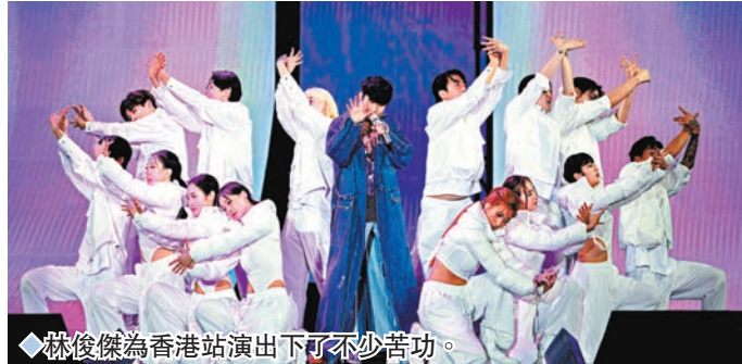
◆林俊傑為香港站演出下了不少苦功。