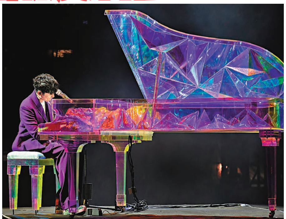
◆林俊傑彈着鋼琴緩緩登上舞台，以一曲《記得》揭開演唱會的序幕。

這次演唱會，JJ 特選了 40 多首歌來送給香港站的歌迷，結合 JJ 20 年來的點滴，再加上重金投入的絢爛煙火綻放夜空，與主舞台身後香港地標性建築群的經典夜景交相輝映，伴隨着演唱會歌聲傳遍維港兩岸，圓滿了《JJ20 世界巡迴演唱會》香港站的首場演出。