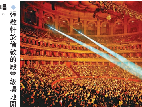
◆張敬軒於倫敦的殿堂級場地開唱。

地，跟大家分享他的音樂是他的榮幸，他亦把這次當作是自己的一次考試，觀眾是考官，希望每一位觀眾都可以感受到他盡全力的演出，給他掌聲及鼓勵。他又說特意提前十天飛抵倫敦備戰，適應天氣及時差，雖然作用不大，每晚都會凌晨 2、3 點便睡醒，發現倫敦冬天又乾又冷：「係街上總是覺得好凍，行過街道公園時，覺得如果身邊有一個可以拍拖嘅人就好啦。寒冷氛圍令我諗起以前戀愛經歷。」