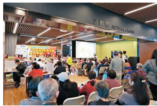
◆首場「長新冠健康諮詢日」昨日在銅鑼灣舉辦，提供中醫義診及專題健康講座。

未來5場諮詢日分別於下個星期日（3月26日）假將軍澳尚德邨尚美樓尚德社區會堂舉行，其餘包括4月2日在馬鞍山恒安社區中心、4月9日在荃灣大河道雅麗珊社區會堂、4月16日在上水彩園邨彩園會堂及5月14日在大埔太和邨林村公立黃福鑾紀念學校舉辦相關活動，時間為當天上午10時至下午3時。