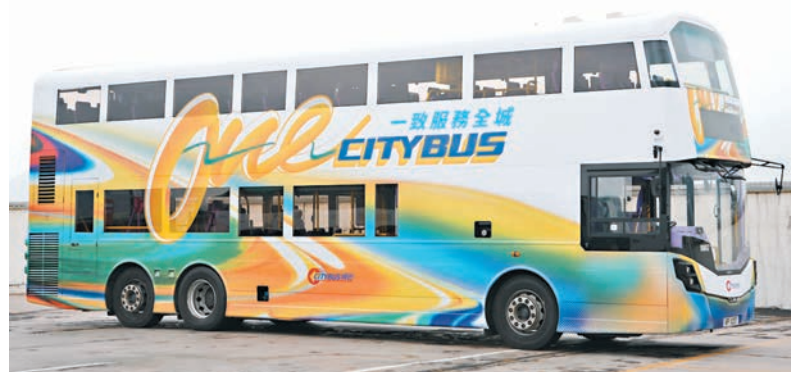
▲城巴新巴展開以「一致服務全城」為主題的合併宣傳活動，有關宣傳車將行走城巴路線，穿梭港九新界。

橙色、綠色「波浪紋」巴士車身，是新巴成立初期的象徵，也是不少乘客的集體回憶。城巴新巴昨日啟動一系列「光榮告別新巴」活動，除有4輛現役巴士變成復刻巴士，行走主要過海、將軍澳及西九龍路線外，並會翻新已退役的富豪巴士，保留新巴成立初期湖水藍的配色扶手、座位上花紋、下車按鈴等，讓市民參觀，由內到外回味昔日坐巴士的感覺，近距離拍照，跟新巴告別。