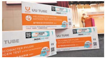
◆幽門螺旋菌快速抗原測試。