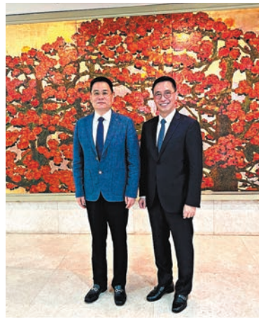
◆楊潤雄(右)昨日在廣州與廣東省文化和旅游廳廳長李斌(左)會面。