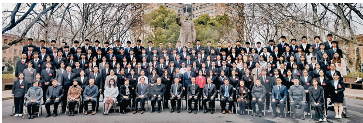
◆來自內地12所高校的超過160名學子和他們的老師相聚在同濟大學，參加曾憲梓教育基金會第八期「優秀大學生獎勵計劃」2022年度頒獎大會。

香港文匯報訊(記者張帆上海報道)「感謝曾憲梓先生和他的家人!」3月18日，來自上海、江蘇、浙江、湖北、福建、安徽12所高校的超過160名學子一起聚集上海同濟大學，參加曾憲梓教育基金會第三十四屆理事會會議暨第八期「優秀大學生獎勵計劃」2022年度頒獎大會。大家在分享獲獎喜悅的同時，也共同在同濟校園發出上述由衷的感謝之聲。