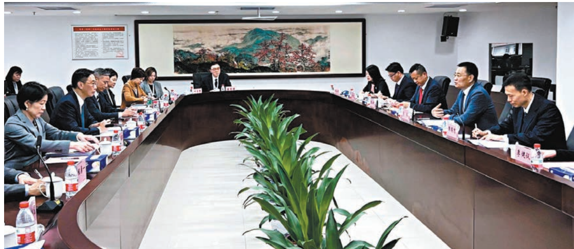
◆楊潤雄(左二)昨日在廣州與廣東省文化和旅游廳廳長李斌(右二)會面，雙方交流意見及探討加強合作的機會。旅遊事務專員沈鳳君(左一)及旅遊業界代表亦有出席。

香港文匯報訊 香港特區政府文化體育及旅遊局局長楊潤雄昨晨在廣州禮節性拜會廣東省文化和旅游廳廳長李斌，雙方交流意見及探討加強合作的機會。楊潤雄表示，特區政府一直重視與廣東省的聯繫，民間交流亦頻繁，文化旅游方面大有合作發展的空間。