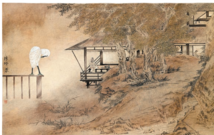
陳林作品《雲起·六如開夏》