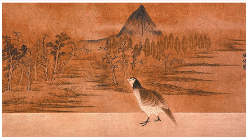
陳林作品《暢神·鵲華之秋》

隨着對中國傳統文化研習的深入，陳林愈發覺得中國畫博大精深，激起他探問傳統文脈本質的願望。2012年以來，陳林開始着手減弱繪畫中當代圖像元素的介入，隱去以往作品中如窗櫺、屋簷等建築結構的描述，取而代之的是濃厚傳統古典意味的構建，從而為禽鳥的往返暢遊營造了良好氛圍。他連續多年創作完成了《暢神》系列作品，全景式地展開了董源、趙孟頫、龔賢的山水畫卷，處於同一時空的禽鳥們顧盼生姿，生趣盎然。