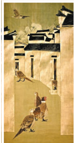
陳林作品《吉祥徽州》