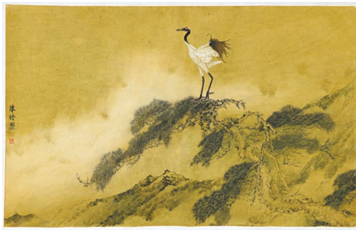
陳林作品《雲起·六如凌風》

陳林，2006年畢業於中國藝術研究院，獲博士學位。安徽省文聯副主席、安徽省美術家協會主席、中國美術家協會會員、中國工筆畫學會理事、安徽大學藝術學院教授。先後在美國西雅圖《世界日報》畫廊、西雅圖Linda Hodges畫廊、廣東省文聯美術館等國內外多地舉辦個展，出版《唯美新勢力·陳林工筆花鳥畫精品集》《新工筆文獻叢書·陳林卷》《別開新聲·陳林工筆畫作品》等作品集。作品先後被中國美術館等機構收藏。