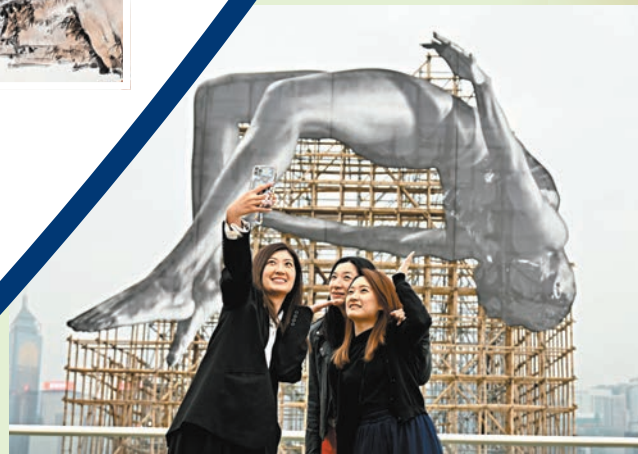
「GIANTS: Rising Up」公共藝術裝置吸引觀眾打卡。