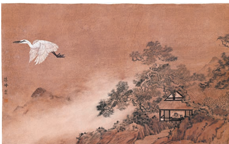
陳林作品《雲起·子畏仙夢》