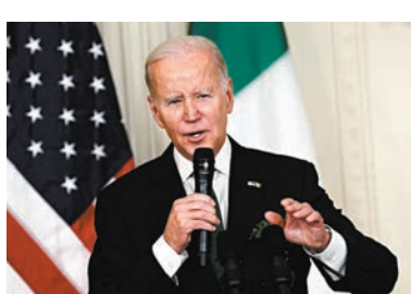
◆拜登多次繞過國會表決。