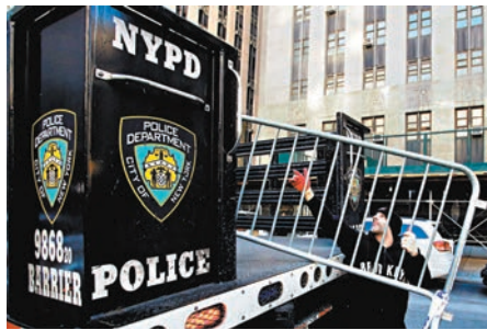
◆紐約警方在法院外架起鐵馬。