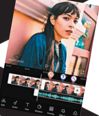
▲跟隨 CapCut 指引即可創作優秀影片。網上圖片

名下產品的影片剪輯程式 CapCut，近期在美國下載量已超過 TikTok。儘管報道不斷設法提及對所謂「數據外洩風險」的擔憂，卻也不得不承認 CapCut 已成為全美最熱門的一款程式。