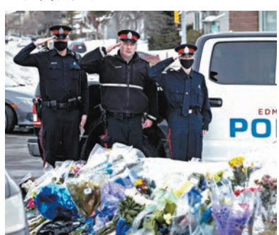
◆加拿大過去半年有 8 名警員在執行公務時遇襲殉職。

槍」的 3D 打印槍極難偵查來源，不法之徒可以在網上購買製造 3D 打印槍製造程式，然後自行用一部只售 300 加元（約 1,715 港元）的 3D 打印機生產。警方預料今年在市面流傳的自製槍械將會大幅增長，並且估計一支 3D 打印槍的售價，將會界乎 2,500 至 7,500 加元（約 1.43 萬至 4.29 萬港元）。