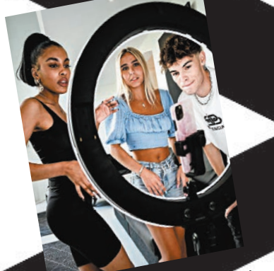
▲美國青少年愛玩 TikTok。

美國近期以「威脅美國國家安全」為由，施壓在美封殺影音分享平台 TikTok，但事實證明真正優質的應用程式，總是能得到用戶喜愛。《華爾街日報》前日報導稱，同屬中國字節跳動