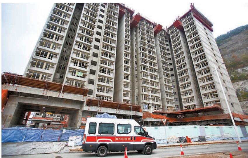
◆秀茂坪安倫道安秀苑居屋地盤昨日發生致命工業意外，一名工人從15樓高處墮下死亡。

他建議，政府除應該公開每宗致命工業意外調查報告詳細資料外，亦需盡快通過職安健條例修訂以加強罰則，包括增加初犯罰款金額，重犯者更要判處監禁刑罰，以收阻嚇作用。