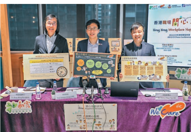
◆「香港開心D」公布港人職場開心指數。

香港文匯報訊(記者 文森) 社企「香港開心D」的調查發現，若以10分滿分，今年受訪打工仔的開心指數僅5.15分，較整體人口(包括在職和非在職)的6.59分明顯為低，三成職場受訪者的開心指數低於5分，主要是對薪酬不滿意，以及工時過長。研究團隊指出，港人工作時數過長，約四成受訪者表示工作出現過勞情況，影響身心，建議政府繼續鼓勵特別假期和彈性工作，以及家庭友善政策，改善香港打工仔開心指數。