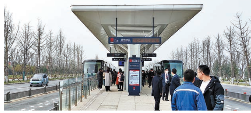
◆西北首條智軌線路採取雙線運行，快捷方便。

人工湖」，如今的昆明池則成為一處集遊覽、觀賞、休閒、娛樂和度假等功能於一體的旅遊目的地。「以前去昆明池都是自己開車，這次智軌把周邊景點都串起來了，特別方便。」市民王女士告訴香港文匯報記者，這周末她就計劃和孩子一起去體驗。