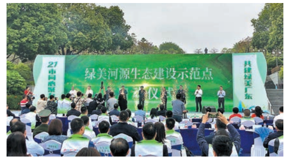
◆作為粵港重要飲用水源區，河源市啟動「綠美河源」生態建設示範點。

據透露，目前廣東全力推進創建全省首個國家公園「南嶺國家公園」，並打造國家公園博物館、智慧國家公園等亮點工程，而華南地區首個國家植物園「華南國家植物園」，與位於北京的國家植物園共同形成「一南一北」格局。如此，將進一步築牢粵港澳大灣區生態屏障。廣東省林業局有關負責人稱，下一步，廣東將全力推進森林城市品質提升，推進重要生態空間保護修復、加強生物多樣性保護，致力打造「高質量的生態屏障、高連通的生態廊道、高水平的生物多樣性保護、高品質的自然公園覆蓋」的世界級森林城市群。