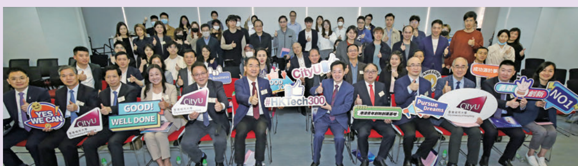
▲出席儀式的嘉賓與城大HK Tech 300初創團隊大合照。