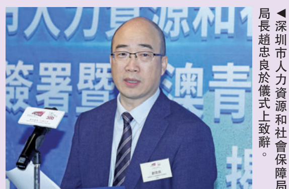
▲深圳市人力資源和社會保障局局長趙忠良於儀式上致辭。