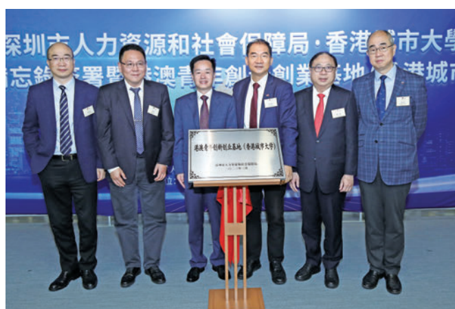
▲活動上舉行了「港澳青年創新創業基地（香港城市大學）」揭牌儀式。

香港城市大學（城大）一直支持本地青年創新創業，並為有意衝出香港的初創團隊提供支援，抓緊香港以至大灣區等其他地區的無限發展機遇。城大於本月17日，與深圳市人力資源和社會保障局（下稱深圳人社局）簽署合作備忘錄，共同在城大位於金鐘的「HK Tech 300共創空間」設立「港澳青年創新創業基地（香港城市大學）」，並推動深圳天使投資引導基金管理公司（簡稱深圳天使母基金）等投資機構設立專項基金，擇優投資獲HK Tech 300支持並落戶深圳的初創團隊。