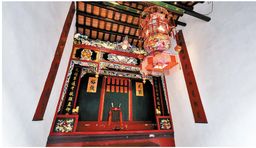
◆ 三棟屋的宗祠與其他客家宗祠不同，只放一塊大神主牌，代表所有祖先。資料圖片

在春秋二祭時，當負責人大叫一聲「拜山」，子孫們便會自動在祖墳前排好。輩分高的站在前排，輩分低的自動會站到後面，不用別人指引。而在各人之中輩分最高的會擔任司禮，用客家話向先祖稟告，祈求