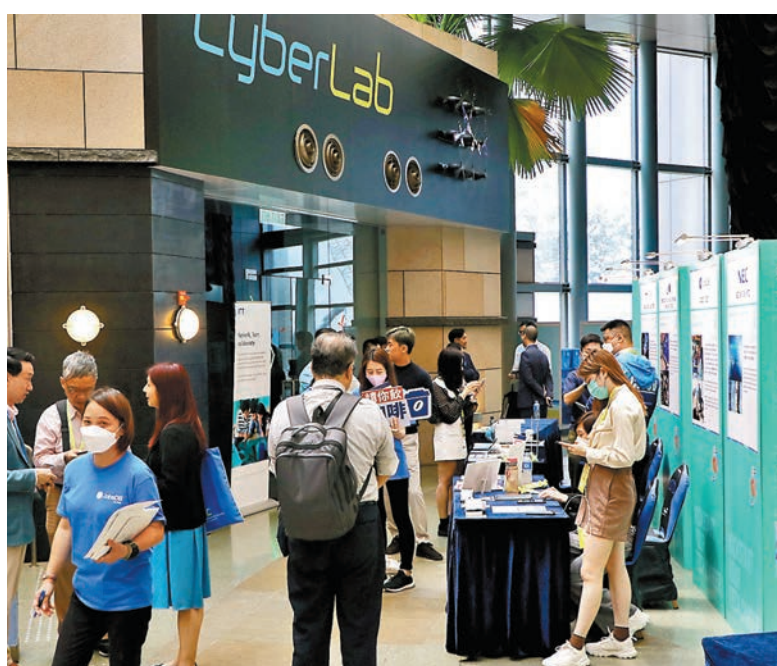
◆數碼港互動招聘博覽會提供逾1,500個創科職位。

在港大攻讀碩士學位的陳同學未來想從事與人工智能相關的行業,「薪酬是我求職中考慮的首要因素,理想薪酬是兩萬元至兩萬五千元。」他是從內地來港求學的學生,未來計劃留港工作,「考慮在香港找工作因為這邊起薪會比內地高一些。」