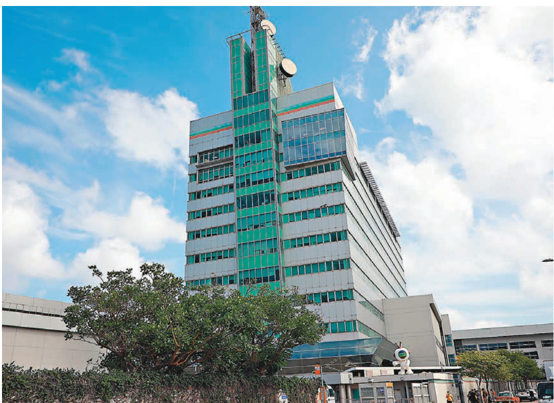
◆無綫將大幅調整節目製作預算,一些未能達到預期收視和經濟收益的節目將被中止。

匯報訪問時表示,無綫作為歷史悠久的廣播機構,工會對其遣散約200名員工表示十分無奈,「遣散不同解僱,即連職位亦削減掉。」