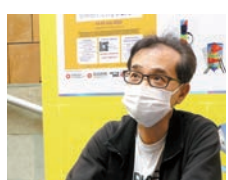
◆智慧城市項目企業的負責人莫先生

智慧城市項目企業的負責人莫先生則說招聘情況不太理想,「高級崗位已經有合適人選,但初級崗位比較難招人。」他表示,雖然之前都有收到部分應屆畢業生的簡歷,但他們都是今年8月才畢業,「在此之前很難做到全職工作,而我們沒有提供實習的崗位,所以就不太合適。」另外,他說內地人工智能行業非常發達,會考慮吸引內地人才加入。