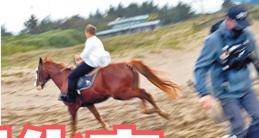
◆馬匹失控衝向小樹林，工作人員慌忙走避。

香港文匯報訊（記者阿祖）任賢齊（小齊）最近推出全新單曲《我出去一下》，歌曲由五月天成員怪獸譜曲兼任製作人，周耀輝填詞。而拍攝