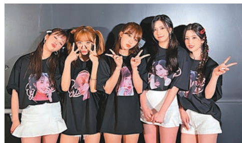
◆Apink日前分別在東京及大阪舉行巡迴。

為了回饋觀眾們的支持，N.Flying更預備了加碼的粉絲福利，希望和更多觀眾作近距離接觸！最吸引的一定是名額加倍的「團體合照」福利，主辦方更爭取到總共500個名額的合照福利，惠及更多觀眾！另一方面，演出後的「歡送道別」福利，也由其他站只給購買最貴門票的觀眾，再加碼送給購買$1,388門票的抽選幸運兒，名額多達680個！最後，還有「簽名拍立得」和「簽名海報」兩大福利。