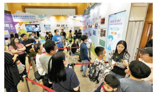
◆天文台昨日起舉行開放日，現場人流較去年顯著增加。

參觀者馬女士表示，知道兒子對天文知識很有興趣，較早前就約好一家人前來，怎料天氣不似預期，突降大雨耽誤了些許時間，「見到