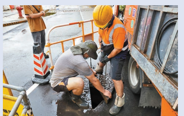
◆屯門醫院因雨水倒灌導致急症室服務受影響，工程人員趕至清理渠道。

至下午3時20分，天文台取消黃色暴雨警告，但雷暴警告仍然生效，市民仍須警覺有關河道氾濫可能帶來的危險。