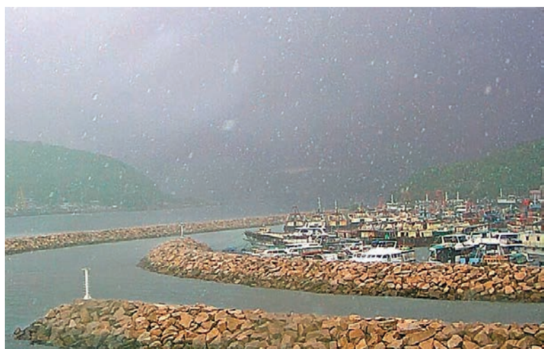
◆天文台在Facebook上載疑似落雹相片。

根據香港天文台資料，過往10年共錄得5次落雹報告，對上一次為2021年9月16日，當時香港局部地區出現大驟雨和雷暴，天文台於下午約1時接獲將軍澳尚德邨一帶落雹報告。至於香港在3月份錄得落雹報告，要追溯至2014年3月30日晚上，天文台在發出黑色暴雨警告期間接獲多區出現冰雹報告。