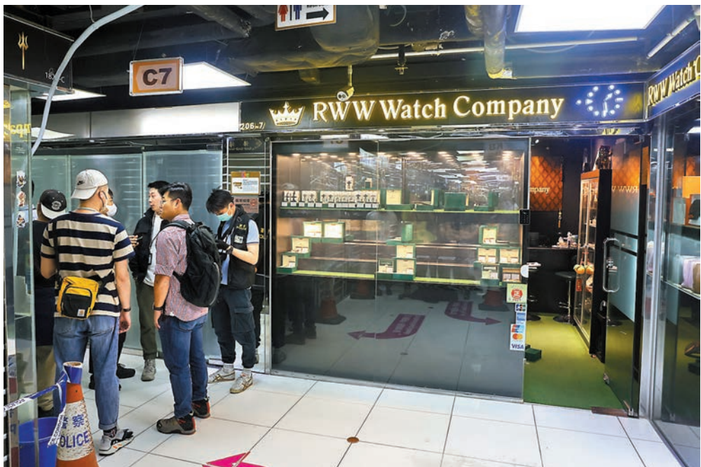
▲尖沙咀「重慶站購物商場」一間銀行被劫，警員封鎖現場調查。

價66.8萬元的勞力士Daytona綠面手錶。香港去年全年發生77宗劫案，是十一年來最低，昨日的劫案可謂今年較嚴重的一宗。今年1月12日，旺角彌敦道總統商業大廈二樓一間二手錶行也遇劫，兩匪掠走7隻總值140萬元名錶，4天後落網。去年8月31日，銅鑼灣駱克道謝氏錶行，被4名本地男子持疑似手槍、利刀及鐵錘行劫，指嚇職員，掠走約70隻總值約1,300萬元名錶，4天後亦全數落網。