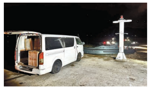
◆私梟在碼頭棄下客貨車和私貨，跳上快艇逃去。

海關兩艘高速截擊艇駛往沙螺灣堵截，惟走私分子非常狡猾，察覺海關船隻後沒有直線加速，反而貼近深屈灣岸邊的淺水區行駛，海關截擊艇透過雷達指揮中心，一直掌握走私快艇