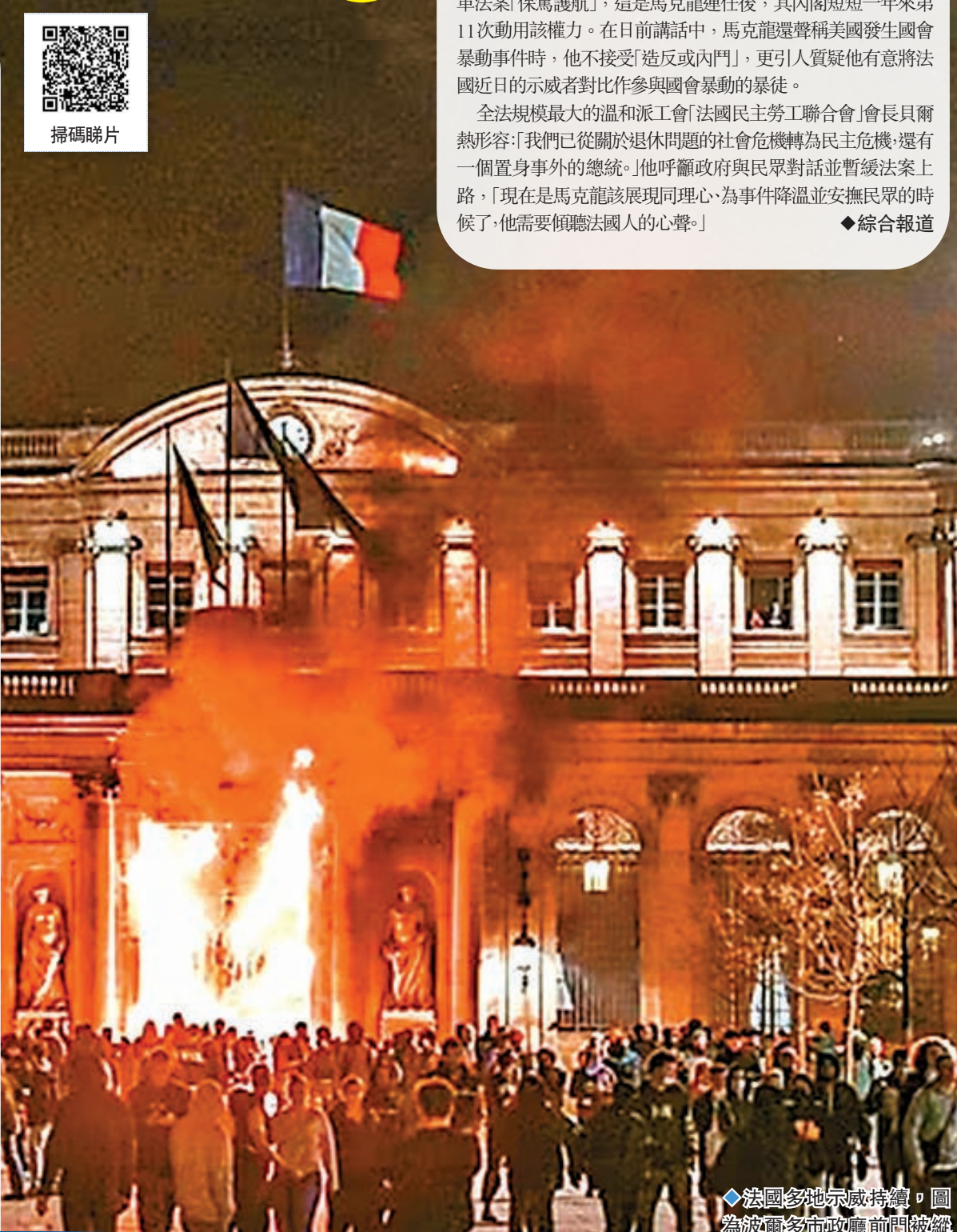
◆法國多地示威持續，圖為波爾多市政廳前門被縱火。