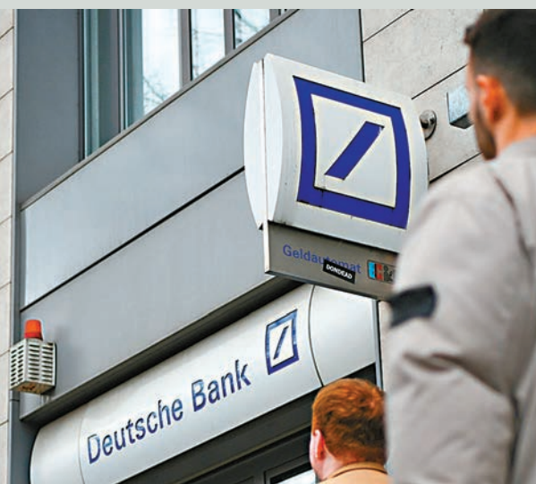
◆德意志銀行股價前日盤中跌幅一度超過14%。

朔爾茨前日則稱，德意志銀行已從根本上完成商業模式的現代化重組，如今盈利豐厚。他亦強調歐盟對銀行監管設有嚴格規則，歐洲銀行系統現時穩定且具有彈性。