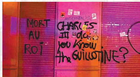
◆法國多地出現辱罵英國王室的塗鴉。