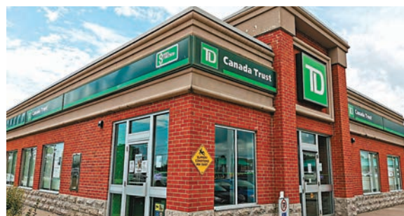
◆道明銀行去年動用134億美元收購美國地區銀行First Horizon，擴大在美國覆蓋範圍。