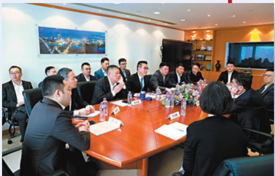
◆拜訪寧興(集團)有限公司。