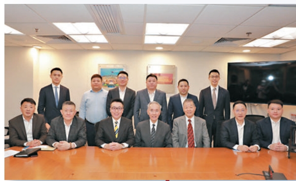
◆拜會信和集團，與全國政協經濟委員會副主任、信和集團主席黃志祥合影。