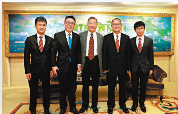
◆拜訪香港中華總商會，與全國政協常委、中總會會長蔡冠深座談交流。