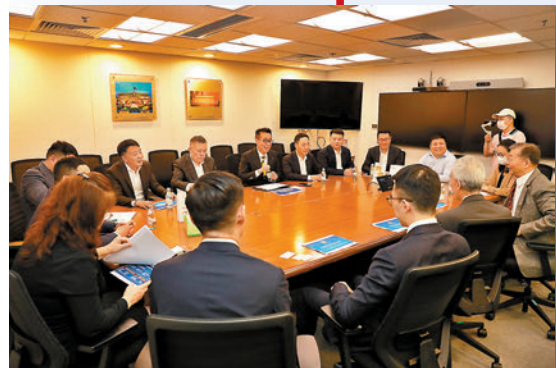
◆拜會信和集團主席黃志祥，雙方座談交流。