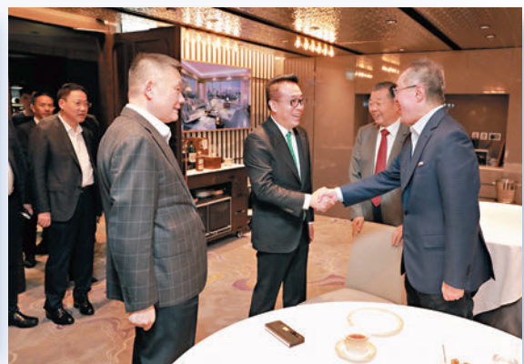
◆拜會全國政協常委唐英年並參加晚宴交流。