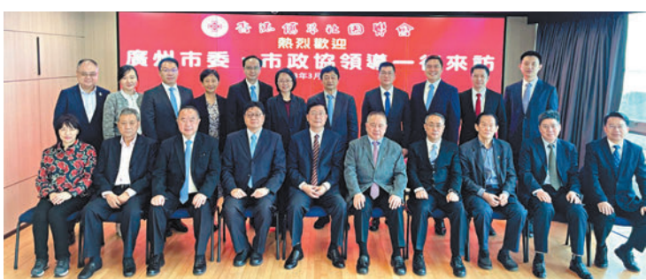
◆香港僑界社團聯合會日前在港接待廣州市委統戰部、市政協訪問團。

中國僑聯副主席、香港僑界社團聯合會首席主席余國春表示，希望廣州和香港加強青年及工商界的交流合作，把握新時代帶來的機遇。在中共二十大和全國兩會後，中國的發展方向更加明確，海上絲綢之路、「一帶一路」及其他在疫期間停頓的項目現已逐步重啟，而廣州在這些重要項目的推行都能發揮重要作用。聯會非常期待開展更多的老、中、青交流活動，與廣州市合力發展經濟、文化和教育等方面的互動溝通，將合作的薪火傳遞到僑二代、僑三代。