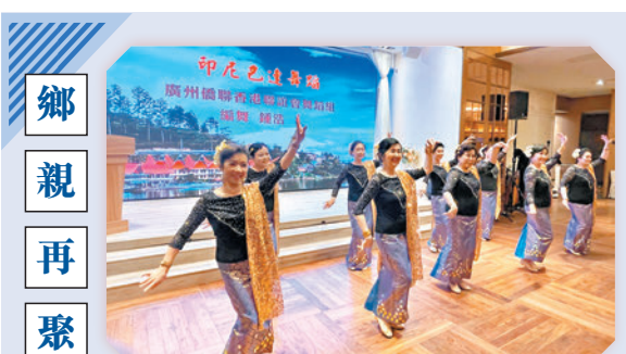
香港文匯報訊 廣州僑聯香港聯誼會與廣州市歸國華僑聯合會昨晚在港舉辦「2023年港穗僑界新春聯歡晚會」，時隔3年，港穗兩地僑界人士再次歡聚一堂，載歌載舞。

此次廣州市委常委、統戰部部長王世彤、市政協副主席武延軍一行10人組成訪問團來港。王世彤熱情邀請香港僑胞探訪廣州，共同見證廣州市過去三年日新月異的變化，並鼓勵僑界同心協力，加強信息、資金、人才往來。