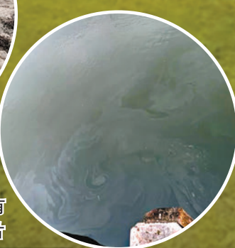
▶在普爾港的水域可看到有油層浮面。