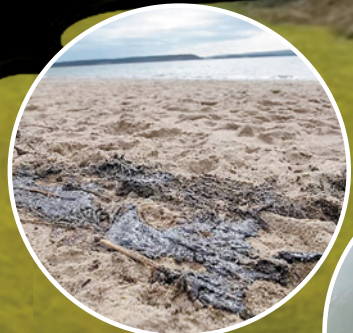
▲普爾港的海灘上可見厚厚油漬。 網上圖片

佩朗科公司表示，威奇法姆油田發生了「有限的漏油」，洩漏的「儲油層液體」以85%的水和15%的油組成。該公司已啟動事故應急管理團隊，管道已被關閉，洩漏已被阻止，昨日會對清理行動再進行評估。