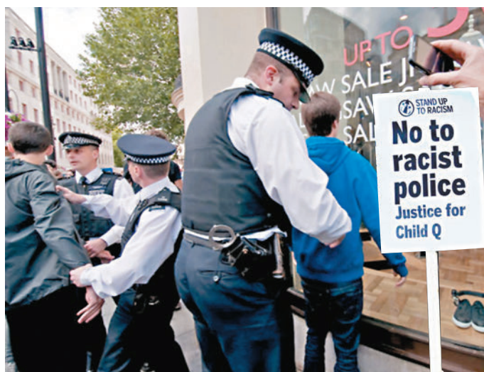
圖為倫敦警察在街頭對兒童進行搜身。

英國國家警察局長委員會表示，將仔細考慮調查結果。內政部發言人稱，任何人都不能基於種族因素被脫衣搜身，「我們非常重視對兒童的保護。」