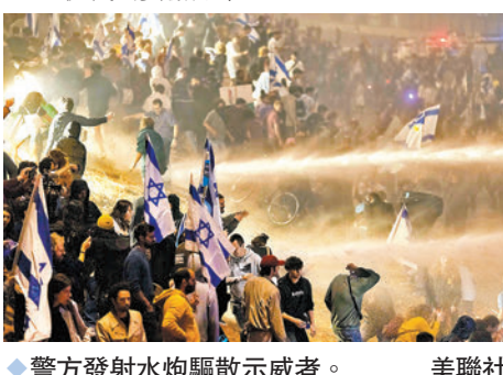
◆警方發射水炮驅散示威者。

美國白宮網站發聲明稱，總統拜登政府對以色列的事務發展深表關切，敦促以國領導人盡快找到妥協方案。