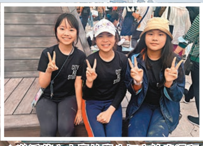
◆激活英文小學的學生坦言繪畫過程辛苦，但完成大型作品感到開心。