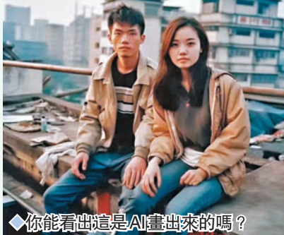
◆你能看出這是AI畫出來的嗎？

另外，Midjourney V5的更新也是讓人驚嘆不已。通過使用MJ5，我們可以輕鬆地繪製出逼真的人物肖像，生成的畫面達到攝影級的水準，而我們無須具備高超的繪畫技巧。傳統的繪畫工具通常需要掌握複