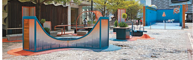
◆香港藝術館展覽「游·遊」於藝術館前方的藝術廣場展出。

日期：2023-03-25 - 2024-03-24 地點：香港藝術館前方 藝術廣場 費用：免費