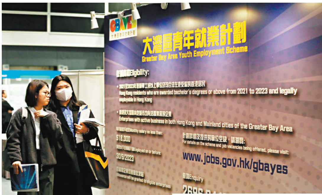
「大灣區青年就業計劃」招聘博覽昨日在會展中心舉行，不少青年到場尋覓發展機遇。

他本身從事房地產業，考慮到互聯網覆蓋面廣泛且從業人員薪酬普遍較高，以及香港金融業發達，因此他昨日到新鴻基、騰訊等公司了解情況。