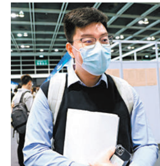
◆王先生看好灣區發展。