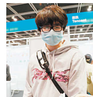
◆羅先生剛從英國回港。