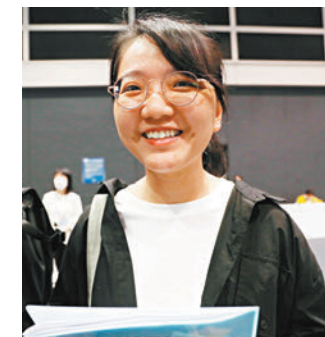
◆吳小姐去年從深大畢業。