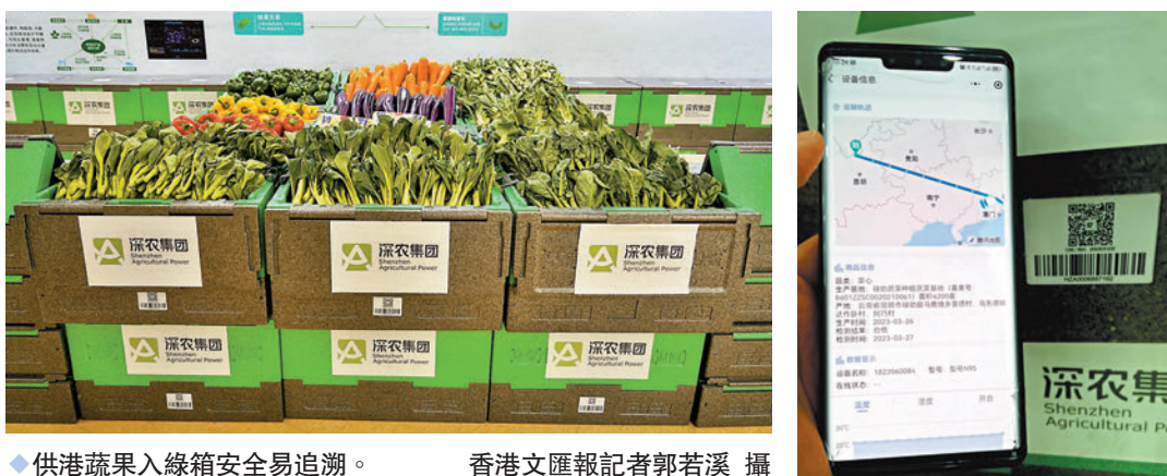
◆供港果蔬入綠箱安全易追溯。