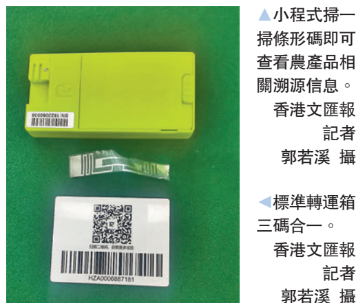
▲小程序掃一掃條形碼即可查看農產品相關溯源信息。