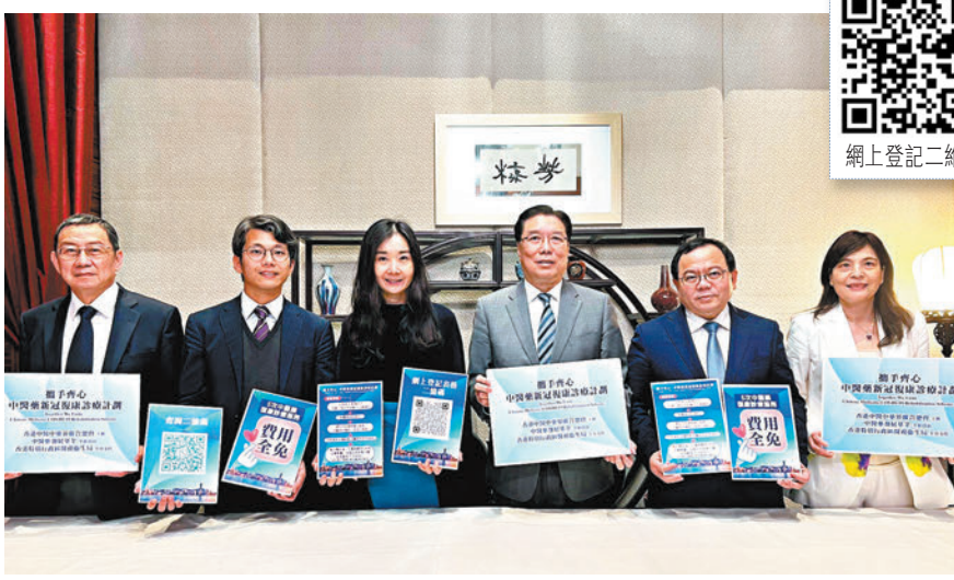
◆「攜手齊心——中醫藥新冠復康診療計劃」（第二階段）4月1日起接受申請，料10,000名市民受惠。