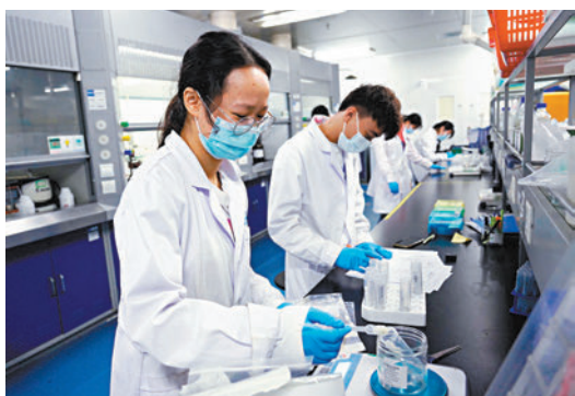
◆第三方檢測機構（F.Q.T）工作人員在對農產品進行抽檢。