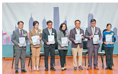
◆國際培幼會推出全港首套《幼稚園守護兒童實務守則》。

培幼會就《守則》及相關內容推出網上學習平台 ( https://cspcertificatc.plan.org.hk )，為幼兒機構及員工提供基礎培訓，首階段供用戶免費登記使用。