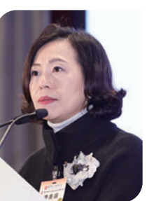
▲民政及青年事務局局長麥美娟致詞。