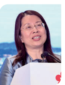
▲全國人大常委會委員、廣東省僑聯黨組書記、主席顏珂致詞。