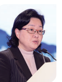
▲梅州市政協主席楊朝暉致詞。