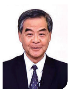
▲全國政協副主席梁振英視頻致詞。