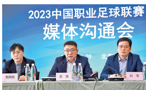
▶中國足協日前舉行2023中國職業足球聯賽媒體溝通會。

中國足協和中足聯籌備組29日在北京召開媒體溝通會，公布2023賽季中國足球職業聯賽准入俱樂部名單。在53家提出准入申請的俱樂部中，有48家獲得職業聯賽准入資格，廣州城、昆山FC、陝西長安競技等5家俱樂部未通過准入。