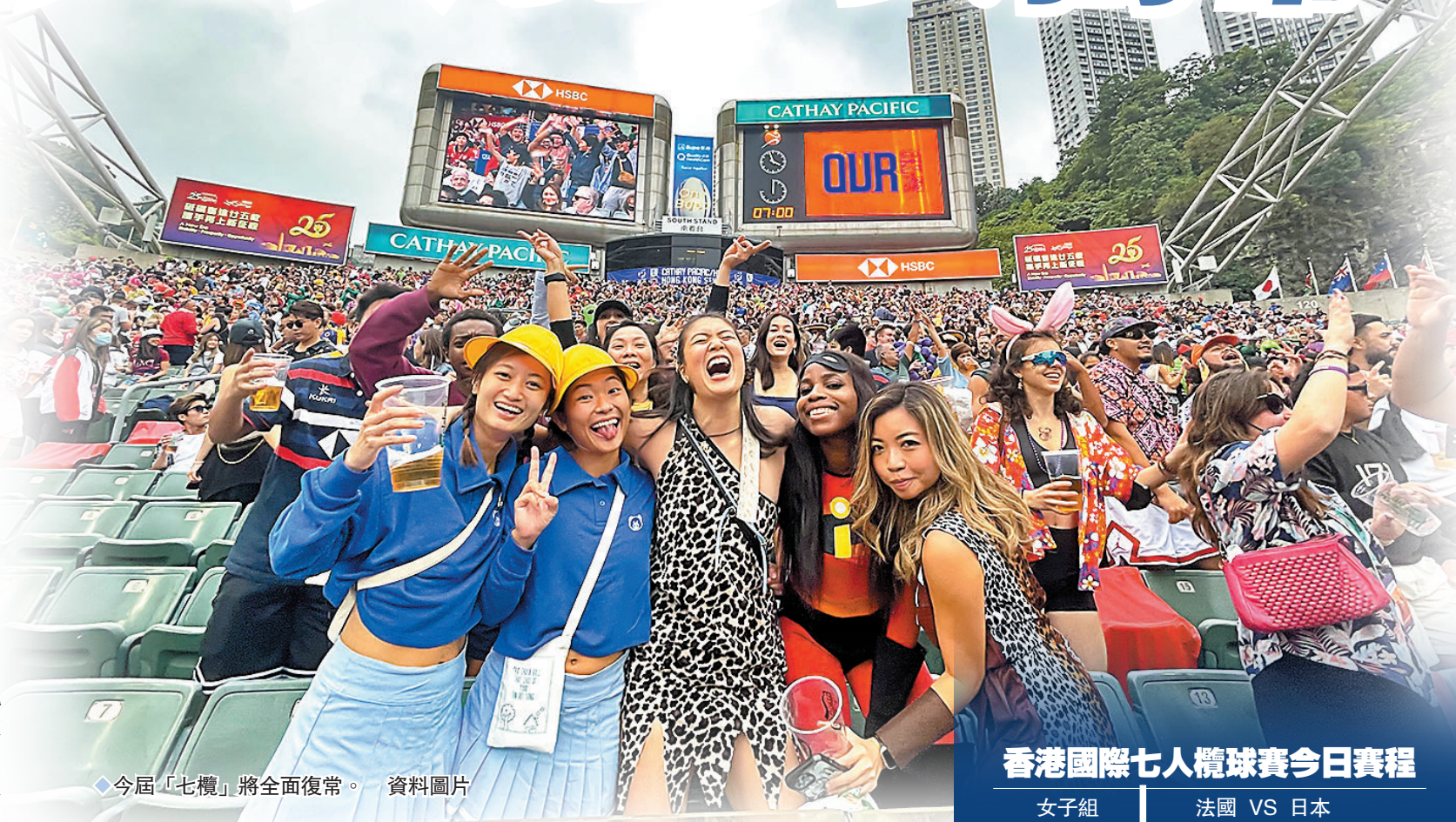
◆今屆「七欖」將全面復常。

香港體壇嘉年華式的盛事「國泰/滙豐香港國際七人欖球賽」今日於香港大球場開鑼，作為全面復常後首屆「七欖」，觀眾除了欣賞精彩刺激的賽事外，更是有得食、有得玩，還可順道追星，享受香港獨有的熾熱派對氣氛。 ◆香港文匯報記者 郭正謙