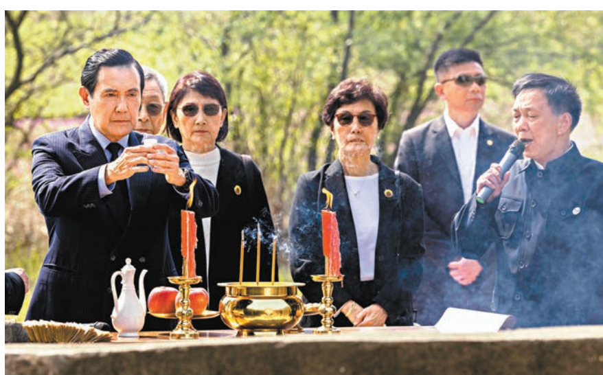
4月1日，在湖南省湘潭縣茶恩寺鎮雙陽村馬家祖墓，馬英九先生在獻酒。

臨別時，馬英九再次走到墓碑前，俯身觀看碑刻，並與家人拍照留念。告別祖墓，馬英九與家人前往位於白石鎮潭口村的寺門前義渡。寺門前義渡