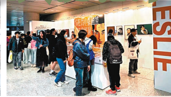
◆有港鐵乘客駐足參觀《你在我心張國榮20年創作展》。

昨日是一代巨星「哥哥」張國榮逝世20周年的日子，大批「哥」迷攜同鮮花冒雨到當年哥哥出事的中環文華東方酒店門外悼念偶像，鮮花擺滿整條街，人龍更排到遮打花園，有粉絲自發做糾察呼籲歌迷保持秩序，亦有警察拉起膠帶及喇叭廣播維持秩序，雖然現場有數百人聚集場面湧擠，但秩序良好。