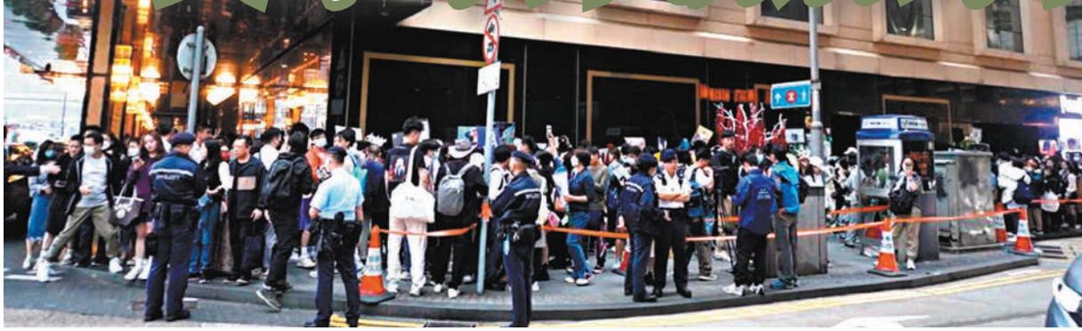
◆文華東方酒店門外鮮花擺滿整條街，人龍更排到遮打花園。