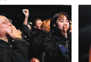
◆曾志偉向現場觀眾大派飛吻。

為加強兩地交流，每集除了會定期在內地進行大型舞台錄影外，還設有分站直播，讓兩地歌手可透過大屏幕進行即時互動，首集分站設在台中著名景點——日月潭。首集固定舞台設計特別，為了配合演唱會模式，大會設計了一個360度週現現場觀眾包圍的舞台，讓演唱歌手與聽眾有更全面及近距離互動。那英演唱《白天不懂夜的黑》時，便笑着透露恍如在舉行演唱會一樣，出名感性的那英，更哽咽談及當年灌錄《白天》時的點滴：「好像演唱會喲，我覺得我的演唱會也不過如此，我唱那首歌的時候才二十幾歲。」之後強忍淚水的那英着全場觀眾大合唱，場面浪漫又感人。