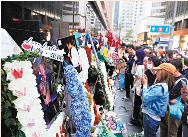
◆由於復常通關的關係，除了有本地歌迷外，還有不少內地粉絲。

此外，港鐵香港站內設《你在我心張國榮20年創作展》，供乘客免費參觀，昨日見不少乘客駐足觀看，展期至4月6日。