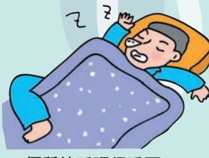
◆優質的睡眠很重要。

現代研究指出，當人的睡眠時間減少，人體的免疫功能會逐步下降，繼而誘發疾病。人的一生有三分之一的時間是在睡眠中度過，優質的睡眠具有消除疲勞、促進發育、延緩衰老、美容強身的好處。失眠催人早衰短壽，與許多慢性病互為因果，因此，防治失眠、提升睡眠質量對防病養生至關重要。養成良好的生活習慣，睡前不進食、不飲濃茶、咖啡和抽煙、不言語；睡臥不張口、不掩面。按時睡覺，按時起床，不熬夜；把握節日長假修心養性、補充睡眠，忌挑燈夜戰，日夜顛倒。