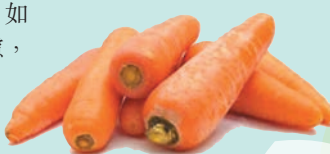
◆春季煲湯以清淡味鮮為主材料，如紅蘿蔔、番茄等。

春季飲食養生重於疏肝健脾、保護脾胃。宜選性溫味辛少酸的食材，如韭菜、洋葱、生薑、豆豉等；建議選食新鮮蔬菜，如菠菜、豆芽等；春季煲湯以清淡味鮮為主要考慮，常選紅蘿蔔、白蘿蔔、海帶、番茄為主要材料，配以雞肝、豬肝、瘦肉等，並以胡荽、生薑絲為調味。保健湯水仍需考慮個人體質，即使是時令湯水也宜適可而止，一周一至兩次即可。