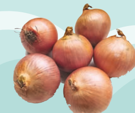
◆性溫味辛少酸的食材，如洋葱、生薑等。