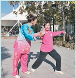
◆大家可根據自己的身體情況選擇適合的運動，如打太極拳。

運動能提高人體的抵抗力。運動量應由小到大，循序漸進，鍛煉以身體發熱，微微出汗，鍛煉後以感到舒適為標準。具體而言，可根據自己的身體情況選擇適合的運動，如打太極拳、八段錦、瑜伽、郊遊、散步、慢跑、跳社交舞等，強化心肺之氣，從而增強抵抗力。尤須注意的是，老年人體質虛弱者，宜適度運動，提防運動後出汗當風因而讓邪氣乘虛而入，不宜進行令身體不勝負荷的運動，避免誘發痼疾。