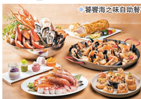
根廷紅蝦刺身；深受大眾喜愛的威靈頓牛柳、美國頂級肉眼扒、燒羊架；由米芝蓮星級粵菜明閣主理的招牌叉燒、即切片皮鴨；熱盤美食如西班牙海鮮飯、即製日式大阪燒、潮州螺仔粥、滋補足料燉湯等，豐富美食一應俱全。

有佔地 8,600 平方呎的酒店自助餐廳供應早、午、晚、周末下午茶自助餐，以及清新健康的下午茶。今個月，香港康得思酒店 The Place 便特別推出健康「饗饗海之味」主題自助餐，提供逾百款環球冰鎮海鮮、惹味熱葷及精緻甜品，更於晚餐時段供應由米芝蓮星級中菜明閣團隊主理的招牌叉燒及皮鴨，引領一眾饗客展開舌尖美味之旅。