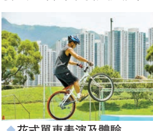
◆花式單車表演及體驗

冬去春來，位於將軍澳的景林商場將推出一系列的好玩健康的單車體驗活動，讓一家大細在景林商場單車亭享受初春騎車樂趣，同時在活動中欣賞人氣熱點跨灣大橋的明媚風景，成為春日運動好去處。早前，商場舉辦一系列特備單車主題活動，包括單車騎行尋寶活動、單車電競 E-ride 挑戰、花式單車表演及體驗等，