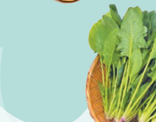
◆新鮮蔬菜如菠菜、豆芽等。