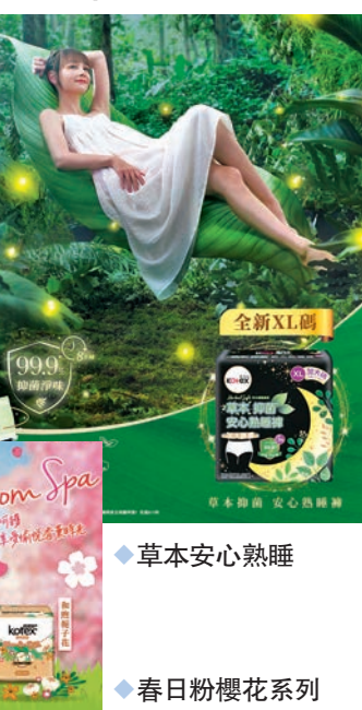
◆草本安心熟睡 ◆春日粉櫻花系列

今個月是女生的日子，有品牌特別因應女生的生理而改進相關產品，早前推出市場獨有的草本抑菌安心熟睡，為女生帶來 99.9% 抑菌守護，近日 Kotex 再次升級產品，加強抑菌守護長達 8 小時，並加推 XL 碼，照顧更多女生的需要。另外，品牌全新 Blossom Spa 系列以獨特的天然 SPA 精華及舒適質感，為女生提供放鬆愉悅享受，讓妳忘卻月事煩惱。今次系列推出季節限定：春日粉櫻花，加入調配天然 SPA 精華，散發淡淡春日櫻花清香，恍如置身於日本櫻花時節當中，令妳可在日常生活中感受 SPA 一般的放鬆感覺。