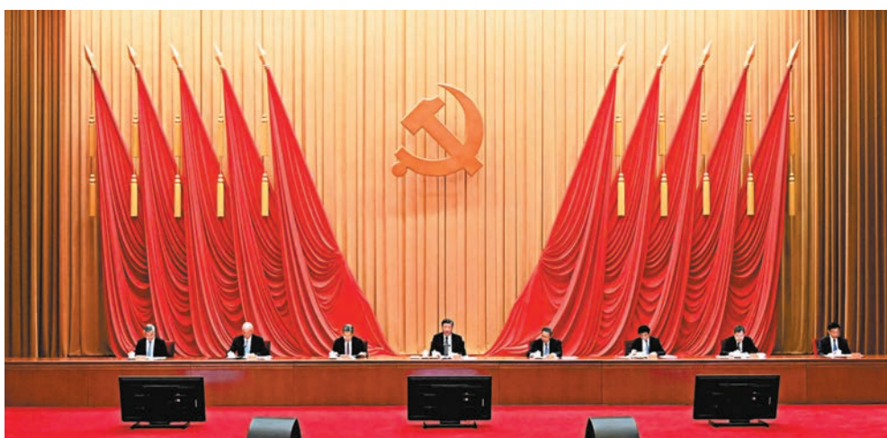
◆4月3日，學習貫徹習近平新時代中國特色社會主義思想主題教育工作會議在北京召開。中共中央總書記、國家主席、中央軍委主席習近平出席會議並發表重要講話。李強、趙樂際、王滙寧、蔡奇、丁薛祥、李希、韓正出席會議。新華社

定性意義，增強「四個意識」、堅定「四個自信」、做到「兩個維護」。要大興調查研究之風，運用黨的創新理論研究新情況、解決新問題、總結新經驗。要把問題整改貫穿主題教育始終，奔著問題去、帶著問題學、對著問題改。要撲下身子真抓實幹，推動高質量發展取得新成效。要走好新時代黨的群眾路線，堅持開門搞教育，解決群眾急難愁盼問題，着力讓群眾得實惠。要壓實壓緊領導責任，加強督促指導，圓滿完成主題教育各項任務。