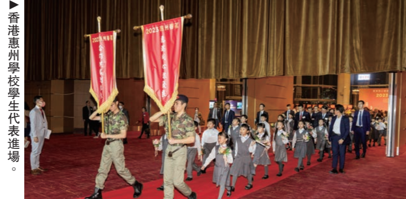
▲元明朗屏邨惠州學校合唱團高歌《我和我的祖國》。