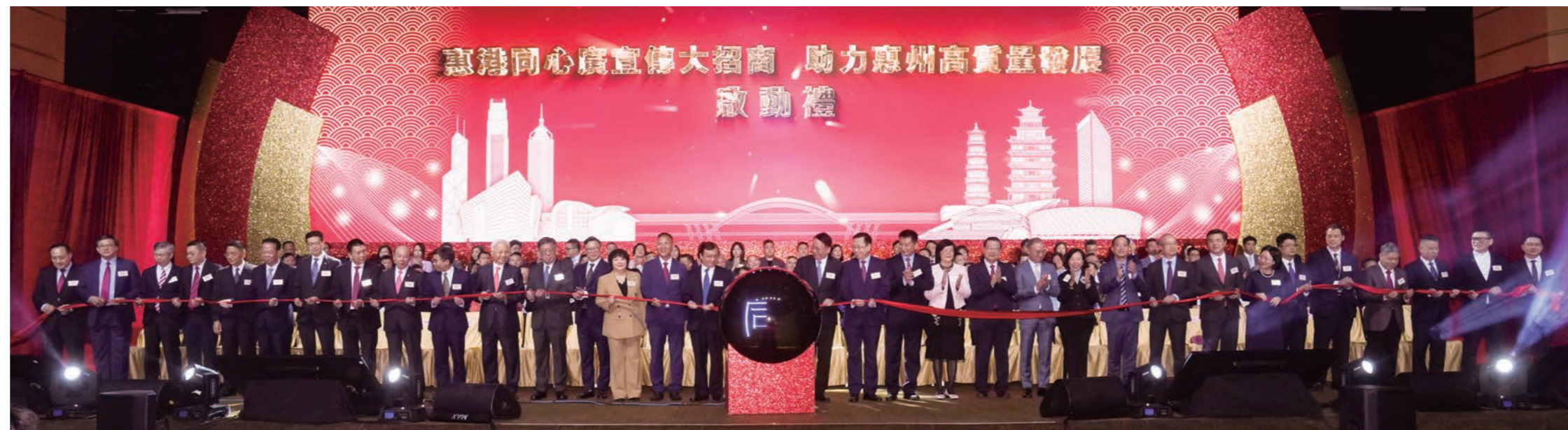
一眾嘉賓進行「惠港同心廣宣傳大招商·助力惠州高質量發展」啟動儀式。

陳國基在致辭中說，惠州臨近香港，土地資源豐富，生態環境優良，經濟增長勢頭迅猛，發展潛力巨大。現在兩地往來更加便捷，運輸及物流效率不斷提升，相信惠港合作一定會更深、更廣、更好。黨的二十大報告提出，推進粵港澳大灣區建設，支持香港、澳門更好融入國家發展大局。香港社會各界備受鼓舞，深感肩負重任。香港特區政府將繼續堅持「互利共贏」的原則，制定及推行各項政策措施，不斷深化惠港兩地交流合作，助力大灣區高質量發展。