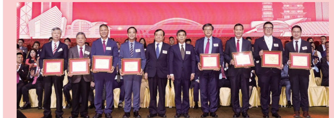
▲外交部駐港特派員公署副特派員方建明、香港中聯辦社團聯絡部部長鍾吉昌為多位新一屆全國人大代表及全國政協委員頒發榮譽金匾。