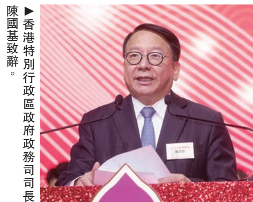
香港特別行政區政府政務司司長陳國基致辭。