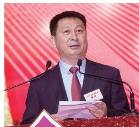
惠州市委書記劉吉致辭。