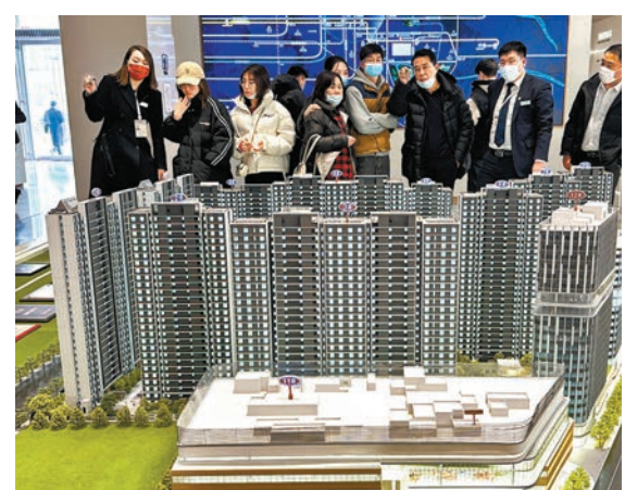
◆ 中指院報告指，內地二季度房地產市場有望趨穩，全年樓市恢復保持謹慎樂觀預期。

香港文匯報訊（記者 馬翠媚）中國人民銀行昨公布，人行行長易綱昨早會見了香港金管局總裁余偉文，就雙方共同關心的經濟金融議題交換了意見。同日人行副行長、國家外匯管理局局長潘功勝亦會見了余偉文一行，雙方就內地與香港金融市場互聯互通、加強溝通合作等進行了交流。