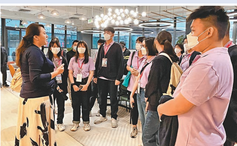
▲港生與Bays work 加速器創始人交流。香港文匯報記者李望賢 攝