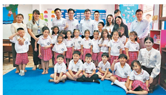
◆教聯會日前到訪老撾的萬象，先後跟當地教育部門的官員會面，並參觀了三所學校。圖為教聯會代表參觀當地學校。

為配合「一帶一路」發展策略以及特區政府「說好香港故事」的工作，教聯會組織了一系列外訪活動。教聯會副主席、培僑書院副校長王惠成，香港升旗隊總會會長李文金上星期六（1日）帶領參訪團出訪老撾萬象，目標是促進香港與老撾之間的教育交流和合作。 交流考察團於4月2日與老撾副總理吉喬、凱坎匹吞、教育部副部長丁馬諾、彭馬哈賽會面。雙方就如何進一步加強師生交流與合作，以及如何借鑒香港的教育經驗、提高老撾的教育水平等交換意見。 老撾副總理吉喬、凱坎匹吞在會上表示，老撾非常重視教育，將教育放在國家發展的重要地位，未來會繼續大力支持外國辦學團體到老撾交流、辦學，特別是華文的教育，期待老撾與香港建立起緊密的聯繫，幫助當地學習好華文，共同提升教育質量。 王惠成表示，此次出訪對加強香港與老撾之間在教育層面交流與合作，別具意義，希望今後能有更多類似的交流活動，讓香港的師生能更加深入地瞭解國家的「一帶一路」發展戰略，並有助推廣香港的教育經驗，說好香港故事。