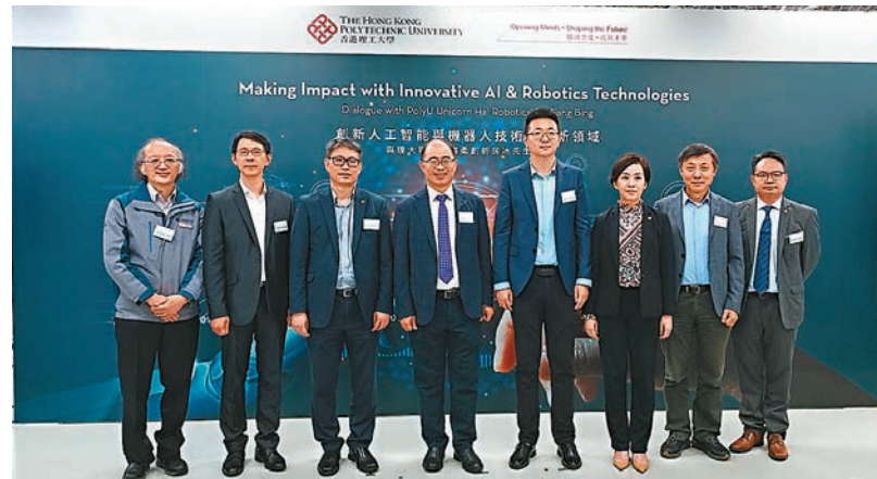
◆理大人工智能機器人實驗室昨日正式啟用。