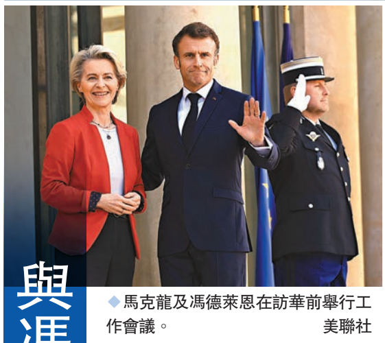
◆馬克龍及馮德萊恩在訪華前舉行工作會議。