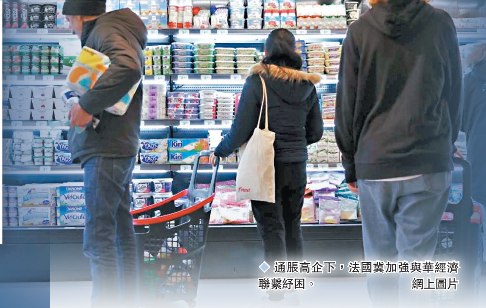
◆通脹高企下，法國冀加強與華經濟聯繫紓困。