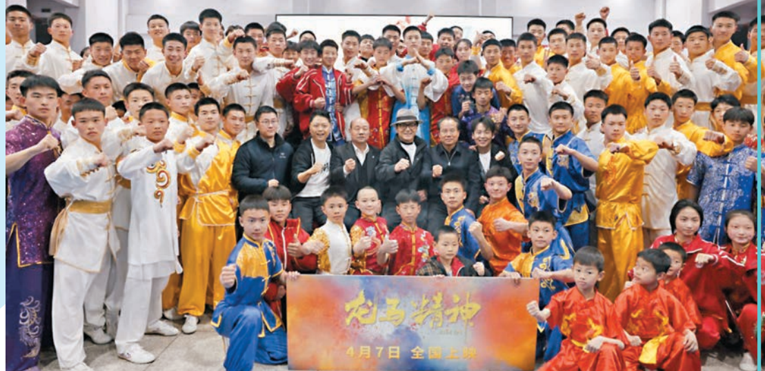
◆成龍與導演楊子、演員郭麒麟等主創人員一起來到塔溝武校。

電影《龍馬精神》由成龍、劉浩存、郭麒麟領銜主演,余皚磊、容祖兒、于榮光、安志杰、小瀟陽、郎月婷、釋彥能主演,吳京特別出演,潘斌龍、賈冰、印小天、唐季禮、呂良偉、李治廷等友情出演。楊子是看着成龍的電影長大的,《龍馬精神》這個故事也在心裏醞釀很多年,在劇本創作階段,成龍就是電影的唯一人選。