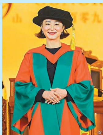
◆林青霞獲港大頒發名譽社會科學博士學位。

林青霞早於1973年憑瓊瑤電影《窗外》在台灣一炮而紅,當時年僅19歲,在演藝界紅足半個世紀。林青霞多年來獲得不少獎項,包括第22屆亞太影展最佳女演員、第27屆金馬獎影后等,淡出娛樂圈轉型作家,作品同樣獲得多項文學獎。