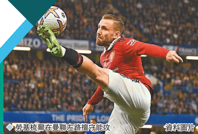
◆勞基梳爾在曼聯左路擅守能攻。 資料圖片