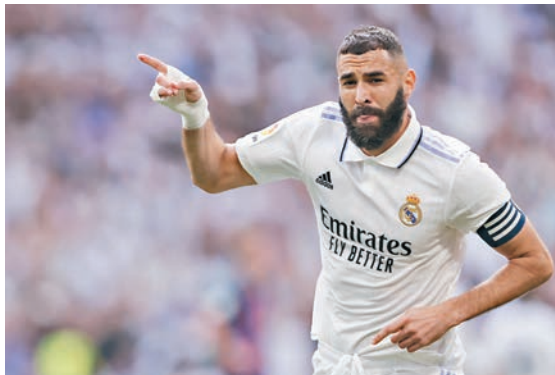
◆賓施馬的連中三元成為皇馬的及時雨。 資料圖片

香港文匯報訊(記者 梁志達) 巴塞隆拿在聯賽榜上仍然大幅領先皇家馬德里，相信重奪失落三個球季的西甲錦標已是時間問題，能否實現2017/18賽季以來首個「雙冠王」，香港時間6日凌晨還要再過皇家馬德里一關。上月西班牙盃4強首回合巴塞作客領先1:0，今仗皇馬要在魯營球場收復失地，已無退路只有進攻一途，坐鎮主場的「紅藍兵團」有力堅守防線再圖反擊。(本港時間周四3:00a.m.開賽)