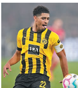
◆多蒙特中場比寧威不後上叩關能力。