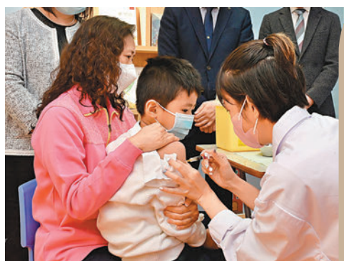
◆圖為前年學童接種流感疫苗情況。資料圖片

香港文匯報訊 小欖醫院嚴重智障科一個男病房自本周二（4日）起先後有6名病人（年齡由25歲至64歲）出現呼吸道感染徵狀。院方已為病人進行所需測試，結果均對甲型流感病毒呈陽性反應。該病房已暫停接收新症，並實施有限度探訪。有關病人現正接受隔離治療，1人因自身疾病情況嚴重，其餘5人情況穩定。院方並根據既定指引加強感染控制措施，及繼續緊密監察該病房病人的健康情況。