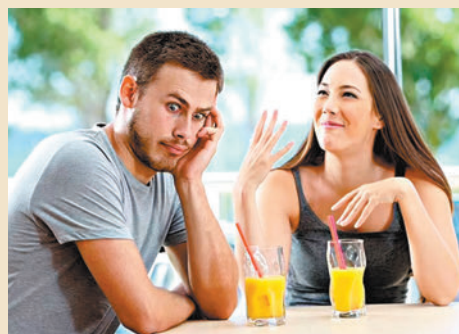
◆約會前利用搜索引擎搜索對象資料，或會受虛假資訊影響。

同時，誣謗聲明不僅要證明聊天機械人說的是假話，且要證明它的言論造成了現實世界的傷害，例如代價高昂的名譽損失。這可能需要某人不僅檢查聊天機械人生成言論，更要合理地質疑它並據此採取行動。