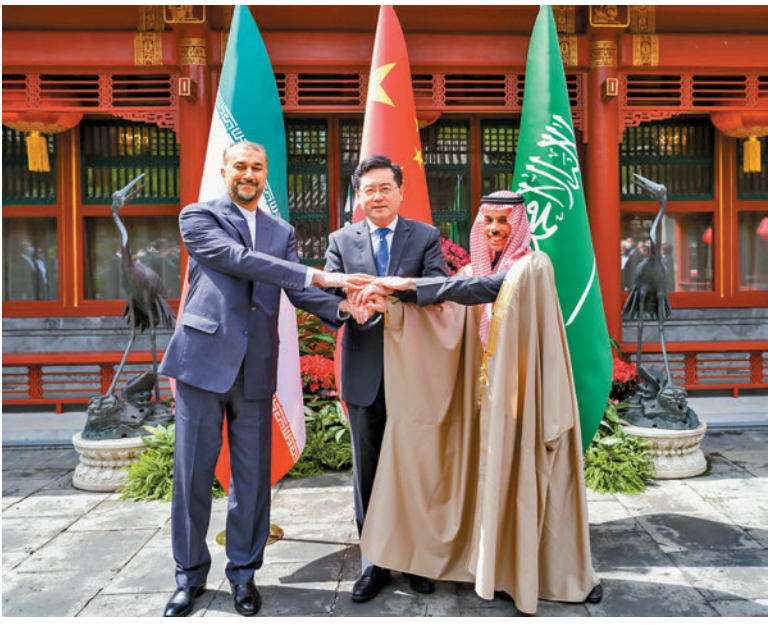
◆中國國務委員兼外長秦剛(中)昨日在北京會見沙特外交大臣費薩爾(右)及伊朗外長阿卜杜拉希揚。

香港文匯報訊 中國國務委員兼外長秦剛昨日在北京會見沙特外交大臣費薩爾及伊朗外長阿卜杜拉希揚。會晤後，秦剛見證沙伊雙方簽署聯合聲明，兩國宣布即日起恢復外交關係。