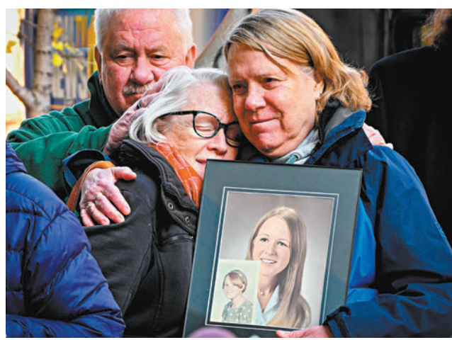
◆倖存者父母向教會報告虐待事件卻無濟於事，去年作出公開抗議。

報告中列舉的施虐神職人員當中，幾乎沒有人受到刑事起訴，當中許多人僅只是被要求還俗或是調離馬里蘭州，如今多數加害者已經去世。除教會系統外，也有警察、檢察官、新聞媒體和至少一名法官在知道虐待行為情況下仍選擇配合教會。馬里蘭州司法部長布朗日前發布報告時表示：「今天是馬里蘭州真相揭露和問責的一天」。現任巴爾的摩教區主教洛里公開對報告內容表達遺憾，以及向倖存者致歉。