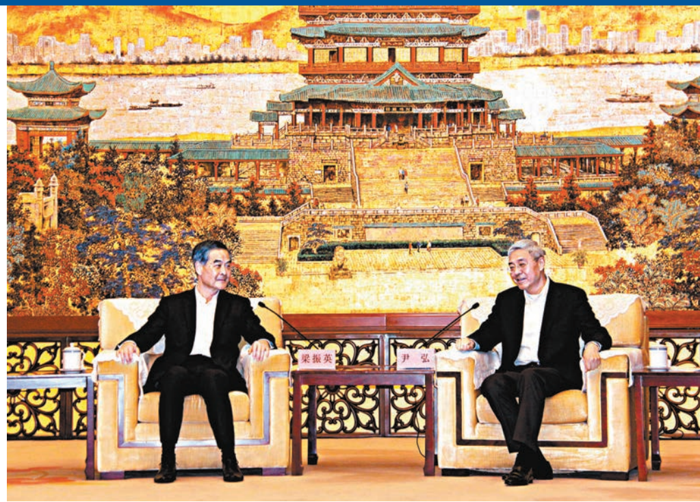
◆尹弘(右)與梁振英(左)會面。