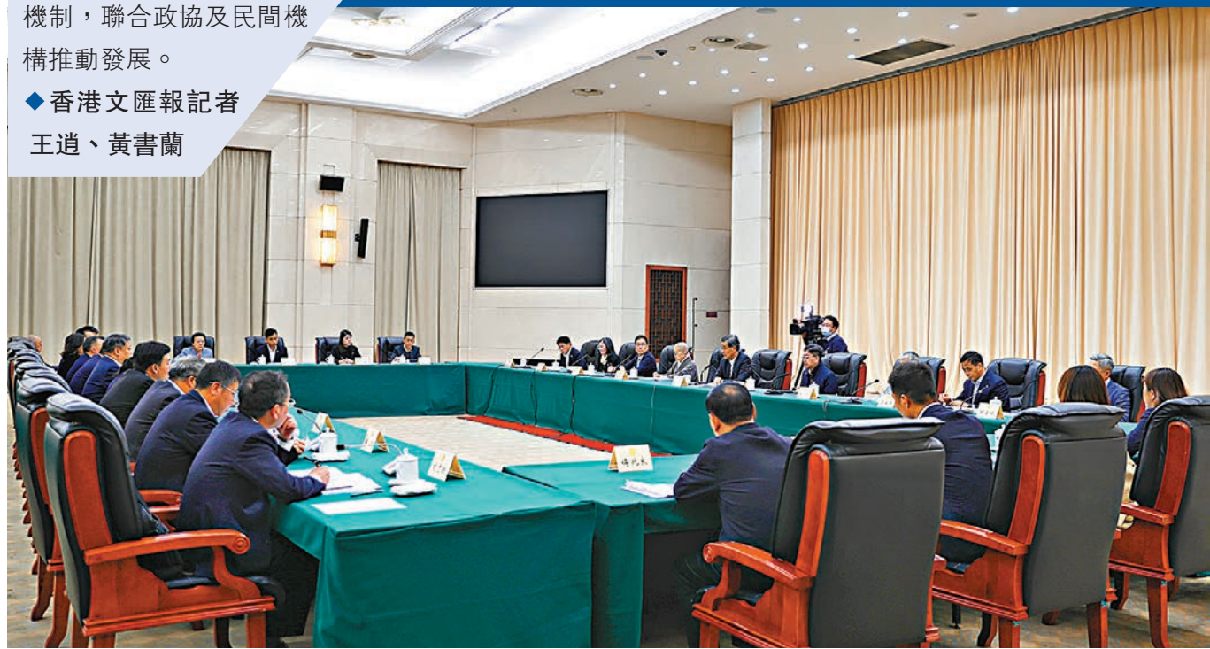
◆「促進贛港精準高效合作」座談會現場。