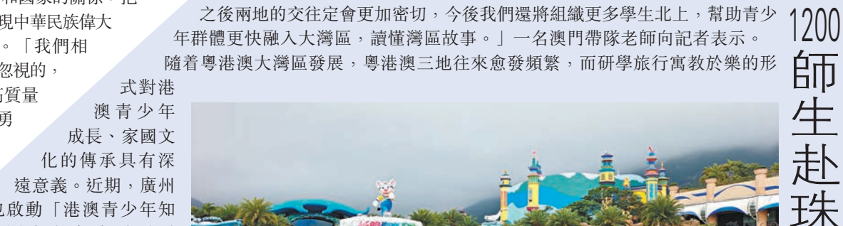
◆澳門學生團體驗灣區新發展。

「今次研學行程非常充實，讓我們體會到大灣區的發展變化，正常通關之後兩地的交往定會更加密切，今後我們還將組織更多學生北上，幫助青少年群體更快融入大灣區，讀懂灣區故事。」一名澳門帶隊老師向記者表示。隨着粵港澳大灣區發展，粵港澳三地往來愈發頻繁，而研學旅行寓教於樂的形