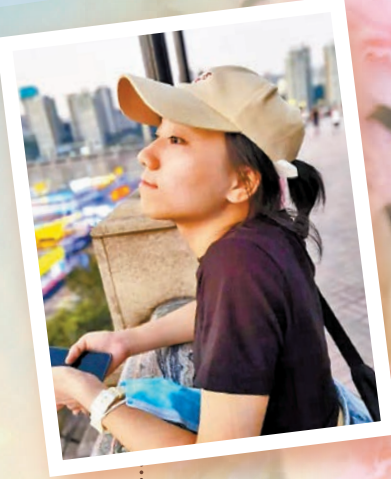
◆陳俊麗 香港文匯報重慶傳真