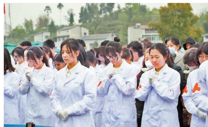
◆醫學院學生和市民向捐獻者默哀。

「有遺體捐贈者在生前曾說過這樣一句話『寧願學生在我身上劃錯一萬刀，也不願意他們在病人身上劃錯一刀』，『大體老師