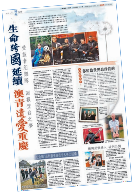
▲香港文匯報曾在2020年1月24日A10版面報道菲利普「一個人的樂隊」事跡。

活動現場，來自重慶首例涉外捐獻者菲利普·安德魯·漢考克先生的5個受體組成的「一個人的樂隊」獻禮公祭活動，用他們的實際行動再次致敬捐獻者。這是重慶首次打破「雙盲原則」公開受捐者和捐贈者信息，當地官方稱此舉是為了更好的宣傳此份大愛。